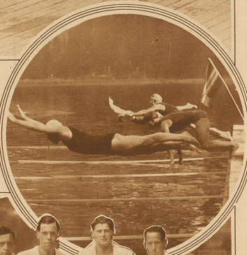
Start zum Ausscheidungsschwimmen für den Länderwettkampf gegen Deutschland