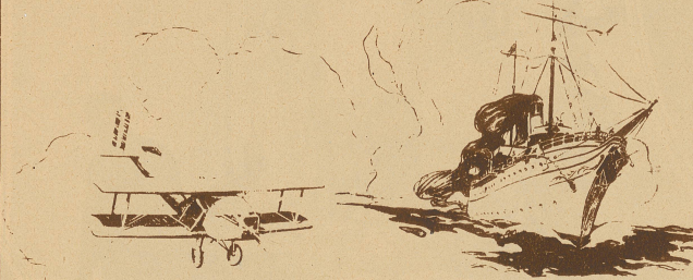
Die Geschwindigkeit eines Flugzeuges

Kein anderer Wagen hat alle diese Eigenschaften aufzuweisen