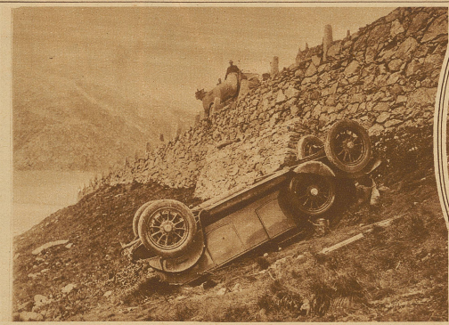
Auf der Furkastraße oberhalb des Hotels Belvedere ereignete sich letzten Montagvormittag ein schweres Automobilunglück. Ein Automobil aus Mülhausen im Elsaß stürzte über den Straßenrand hinaus und überschlug sich. Zwei Damen fanden dabei den Tod, während die beiden übrigen Insassen mit dem Schrecken davonkamen. Unser Bild zeigt das abgestürzte Auto.