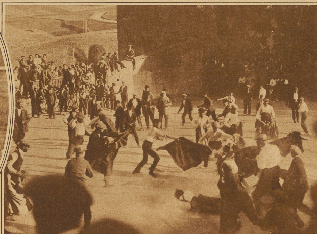
In der kleinen Stadt Cobena (Spanien) finden die Stierkämpfe nicht in einer Arena, sondern, wie unser Bild zeigt, auf öffentlicher Straße statt