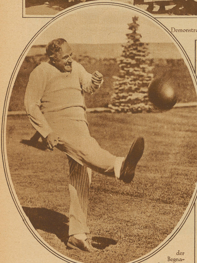
Alvan T. Fuller, der Gouverneur d. Staates Massachusetts, dessen Ablehnung der Begnadigung von Sacco und Vanzetti großes Aufsehen erregte, amüsiert sich beim Fußballspiel