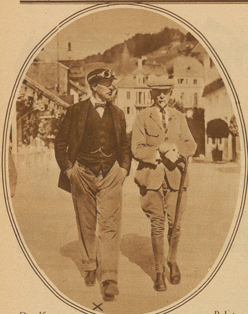
Der König von Belgien, der Engelberg auf seinem Motorrad einen Besuch abgestattet hat, auf einem Gang durchs Dorf.