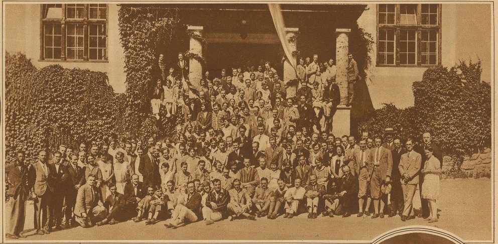
Die Teilnehmer am Weltstudenten-Kongress in Schiers