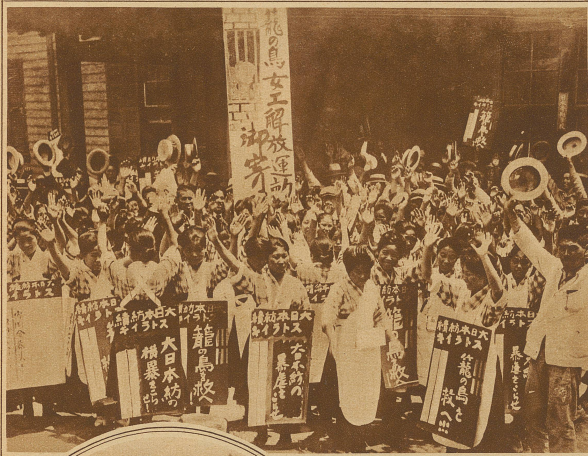
Wie ein Streik in Japan aussieht. Demonstration japanischer Arbeiterinnen und Arbeiter einer Baumwollfabrik