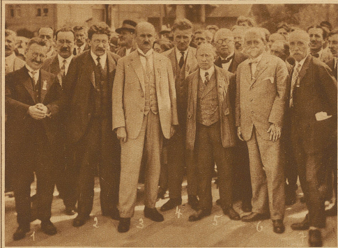
Die führenden Köpfe an der Tagung der soz. «Bodensee-Internationale» in Arbon. 1. Reichstagspräsident Löbe, Berlin; 2. Dr. Adler, Wien; 3. Nationalrat Huber, St. Gallen; 4. Armuzzi, Zürich; 5. Bundesrat Ellenbogen, Wien; 6. Bundesrat Winter, Wien; und 7. Nationalrat Domey, Wien.