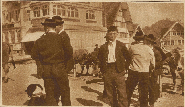
Bauertypen auf dem Viehmarkt in Appenzel