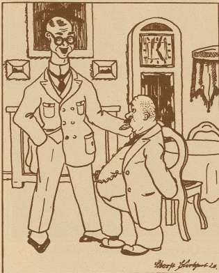
Meier: «Na, Herr Müller, Ihre Jungen haben allerdings 'ne schöne Menge Geld verdienst!» Müller: «Ja, ja, leider, aber der einzige, der dabei geschick geworden ist, der bin ich.»

Verirrt Pfarrer bei der Abdankung am Grab einer Verstorbenen: «Gott hab' sie selig, sie war eine edle, friedliebende und gütige Frau, das Muster einer Hausfrau.» — Witwer im Gefolge der Leidtragenden zu seinem Sprößling: «Gomm, Baulehen, mir sin uf 'ner falschen Beredigung.»