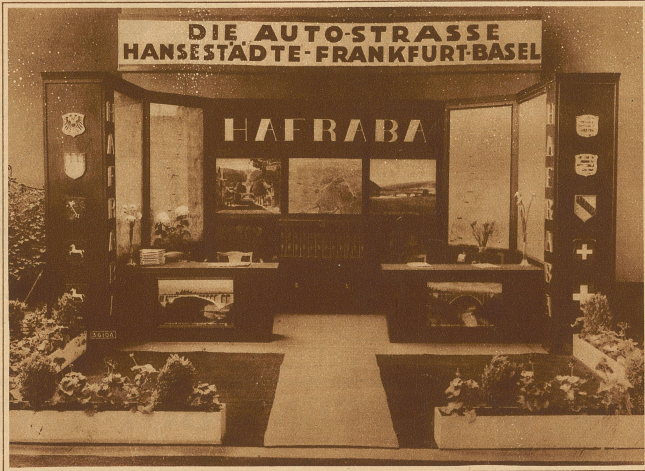
Blick in die Hafraba-Ausstellung in Basel

abzuklären und da gehen natürlich wie bei den Eisenbahnen die Interessen der Ost-Zentral-schweiz mit denjenigen der Westschweiz ausein-