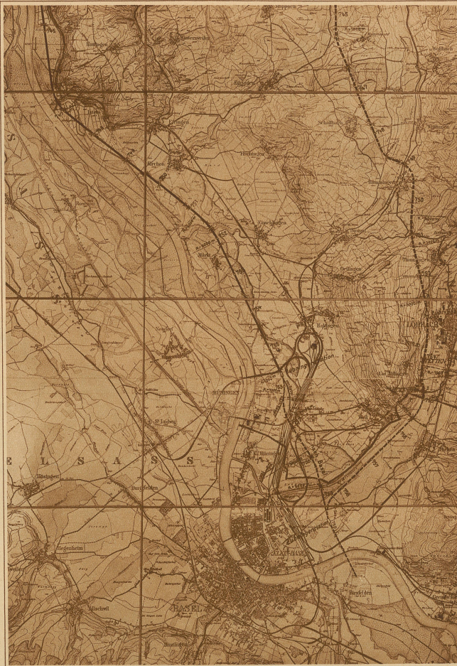
Übersichtskarte für die Einführung der Autostraße nach Basel. Die punktierte Linie rechts zeigt die Variante durchs Wiesental

Während die «Hafraba» eine Autostraße mit ganz bestimmter Route auszuführen hat, ist in der Schweiz zuerst die Frage der Trace-Führung