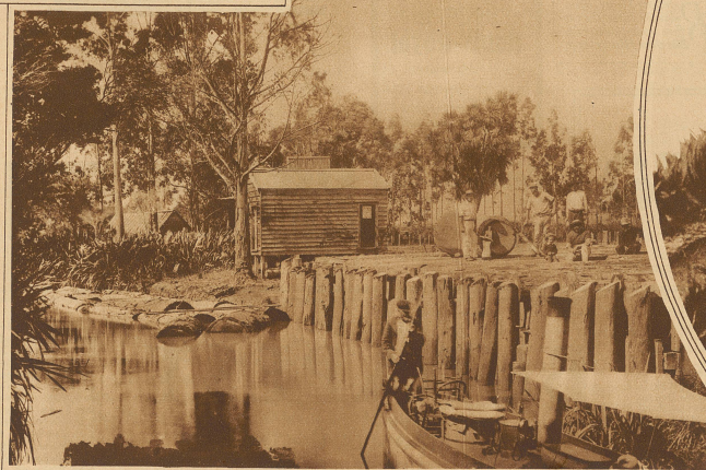
Auf einer Kopalfaktorei, welche gleichzeitig auch die Verschiffung von Holz besorgt

Kein Land in den fernen Ozeanen hat dem späten weißen Eroberer solche Möglichkeiten geboten wie dieses. Sie fanden hier ein herrliches Klima, unvergleichliche immergrüne Urwälder, in denen nicht ein einziges Raubtier, eine einzige Schlange oder nur eine lästige Ameise herumkriechen; fanden einen reichen Boden, schöne Seen und Flüsse, eine Alpenwelt voller Gletscher. Von den beiden großen Inseln war die eine fast unbevölkert, die andere recht spärlich besiedelt von der intelligentesten, kulturfähigsten, wenn auch wildesten Rasse Ozeaniens, den Maori. Heute hat Neuseeland mit seinen tropischen Südseegebieten etwa anderthalb Millionen Bewohner, davon nicht mehr als vielleicht noch hunderttausend Farbige. Die Maori im eigentlichen Seeland zählen kaum fünfzigtausend Köpfe. Die übrigen Einwohner sind nicht nur weiß, sondern fast insgesamt von britischer Abkunft. Die eigenartigsten Erscheinungen des Inselreiches bilden wohl die zahllosen Geiser, die überall aus der Erde empor-