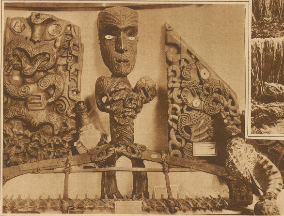
Maori-Schnitzereien. In der Mitte das Standbild einer Madonna mit Kind

Neuseeland, eines von den zukunftsreichen Ländern der Erde, und die vielleicht interessanteste Kolonie des britischen Weltreiches, ist von den Angelsachsen am spätesten besiedelt worden, lange nachdem sie Kanada den Franzosen und Südafrika den Holländern abgenommen oder den ersten Sträflingstransport nach Botany Bay geschickt hatten, dem höllischen Kerker, aus dem das freie Australien hervorgegangen ist.