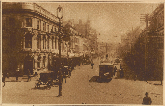
Die Königsstraße in Auckland

die Füße setze. Dieses ganz stattliche Dorf ist über Thermen und Geisern erbaut, die anderswo berühmte Heilquellen wären oder vielbestaute Sehenswürdigkeiten. Und ich weiß auch, was die alten Säcke bedeuten, mit denen viele der Quellen bedeckt sind. Hier kochen die Maori von Ohinemutu, die niemals ein Feuer anzünden, ihr Mittagessen, hängen einfach das Fleisch und Gemüse in das kochende Wasser, oder legen es auf einen hölzernen Behälter, der in den