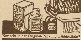
Nur echt in der Original-Packung „Mehlschiffchen“