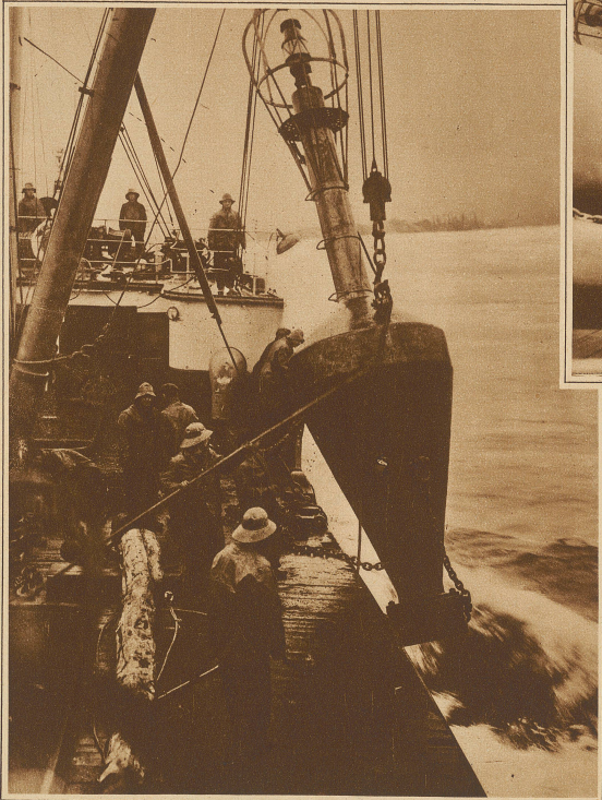
Interessante Aufnahme eines bojenlegenden Schiffes der kanadischen Regierung im Augenblick des Abwerfens einer der ungeheuren Leuchtbojen des St. Lawrenceflusses

Eines der interessantesten Kapitel aus dem Gebiete der Sicherung des Seeschiffahrtsweges ist die Markierung der Wasserstraßen durch Bojen, Tonnen und Baken. Die verschiedensten Konstruktionen sind zu diesem Zwecke im Gebrauch. Unsere Bilder zeigen den Betrieb und die Unterhaltung von Tonnen, die mit Beleuchtung ausgestattet sind, sogenannte Leuchtbojen. In Deutschland ist es üblich, auf der Steuerbordsseite, vom heimkehrenden Schiff aus gesehen, die Schifffahrtslinie zu markieren. Heulbojen, die den Wind für eine Sirene aus-