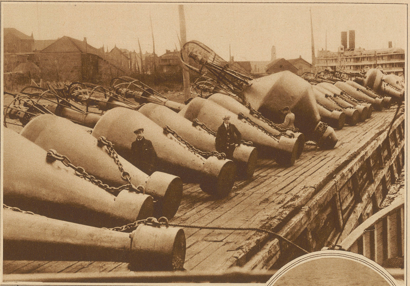
Gewaltige schwimmende Leuchtbojen, die den Kurs auf dem St. Lawrencefluß anzeigen. Diese Bojen werden zur Winterzeit heraufgezogen und zu Beginn der Schifffahrt wieder versenkt

maßen, sind deswegen beliebt, weil sie auch im Nebel warnen. In Amerika werden besonders Leuchtbojen bevorzugt, die mit einer komprimierten Gasfüllung ausgerüstet sind, die zirka vier Wochen brennt. Die Inbetriebhaltung dieser Leuchtbojen erfordert besondere Patrouillenschiffe, welche die Bojen einholen und durch neue ersetzen. Durch Verankerung wird der Platz der Boje genau bestimmt und in die Seekarte zur Orientierung eingetragen. Eine besondere Schwierigkeit ergibt sich daraus, daß die Bojen in Meeresteilen, die unter Treibeis oder Eispackungen leiden, häufig von der Verankerung losgerissen oder beschädigt werden und versinken. Diese Tatsache würde ohne dauernde Kontrolle eine starke Beeinträchtigung der Sicherheit der Fahrzeuge hervorrufen. Aus allen diesen Gründen ergibt sich die Notwendigkeit einer dauernden genauen Kontrolle und Festlegung der Bojen in Übereinstimmung mit den in der Seekarte eingetragenen Zeiten