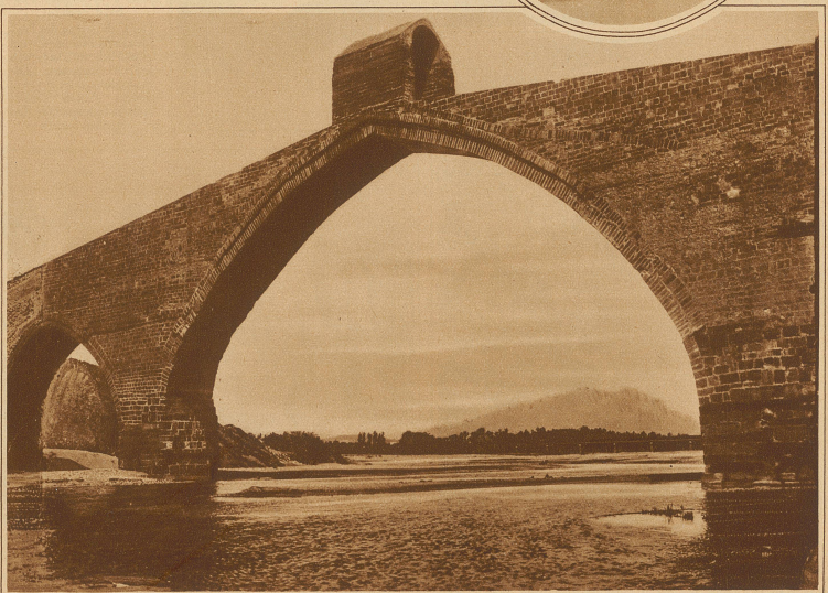
Die «Teufelsbrücke» vom Fluß aus gesehen. Im Hintergrund der Montserrat