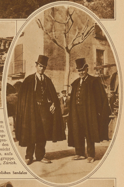
Bild rechts: Polizisten aus Catalonien mit ihren landestüblichen Sandalen