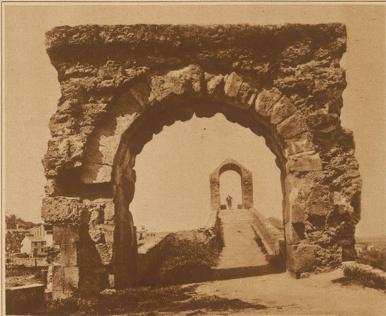
Vorderansicht der Puente del diablo über den Rio Llobregat