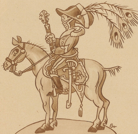
Der Herr Marschalldirektor

Schon Zürich allein hat seine wöchentlichen kleinen Sensationen. Im Stadttheater sucht man seit Saisonbeginn nach einem neuen Titel, der unter Umständen später einmal einem neu ein tretenden Kapellmeister zu verleihen wäre, damit das Publikum recht deutlich erkennen kann, welches der erste, welches der allererste und welches der allerallererste unter ihnen ist. Im Schauspielhaus liebt man hingegen den Direktorentitel so sehr, daß man ihn bereits bis zum Generaldirektor eingeseigt hat, so daß dort mit Bestimmtheit für die nächste Saison der