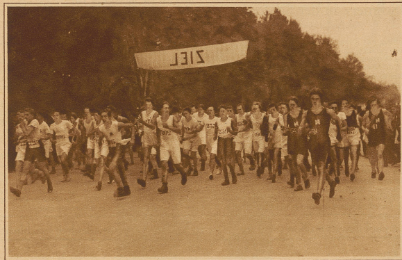
Start der Geher zum 20 km-Straßengehen