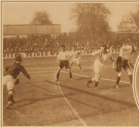
Graßhoppers-Arbon 17:0. Das zweite der 17 Tore