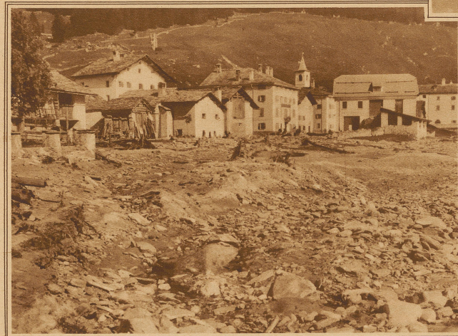
Die Verheerungen in Casaccia im Bergell