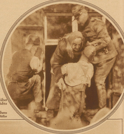
Bild rechts: Rettung eines 86jährigen Mütterchens in Ruggell