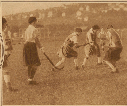
Aus dem Damenhokeyspiel Champel-Graßhoppers 2:0. Vor dem Tor der Graßhoppers