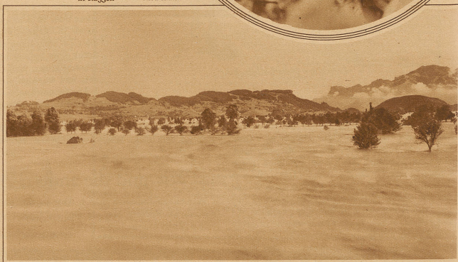
Das Hochwasser in Lichtenstein, das auf etwa 10 km Länge und 6 km Breite das Kulturland überschwemmt und das Dörfchen Ruggell eingeschlossen hat