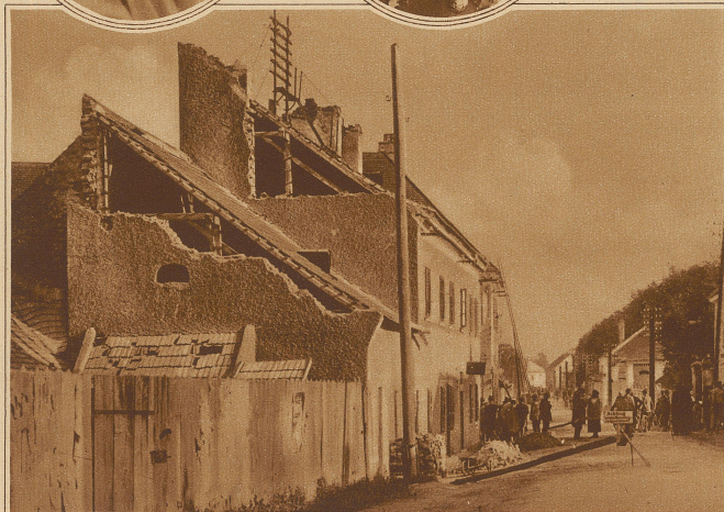
Straßenfront von verwüsteten Häusern in Schwadorf bei Wien