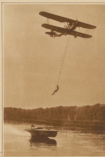
Bild rechts: Eine tollkühne Leistung vollbrachte letzte Woche ein Artist auf dem Templer See bei Potsdam, indem er vom fliegenden Aeroplan bei ca. 150 km Stundengeschwindigkeit in ein Rennboot stieg und eine halbe Stunde später auf gleiche Weise vom Rennboot wieder in das Flugzeug stieg

Bild links: Eine königliche Verlobung. Nach jahrelangen Jähren scherte nun König Boris von Bulgarien endlich doch noch die Gatten für eine standesgemäße Heirat zu finden. Er handelte sich um die Prinzessin Giovanna, die dritte Tochter des Königs von Italien. Einige Schwierigkeiten bieten allerdings noch die Verschiedenheiten des Glaubens, denn König Boris ist griechisch-orthodox getauft, während sich das italienische Königshaus zur römisch-kath. Religion bekennt