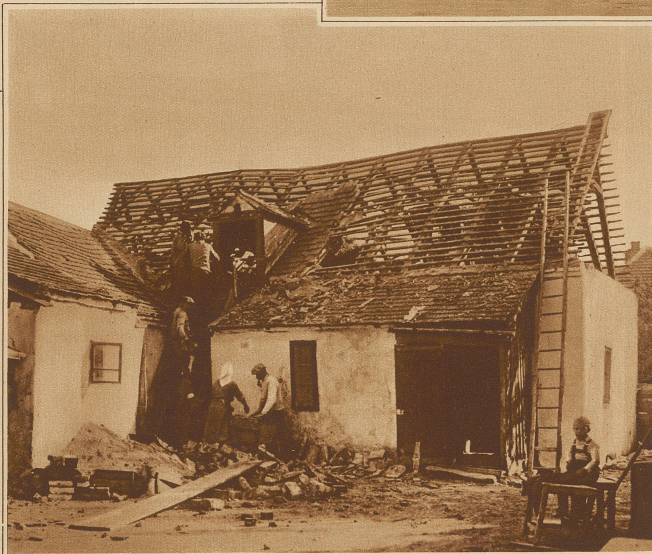
Einwohner eines Hauses in Schwadorf retten ihre Habe aus dem vom Erdbeben zerstörten Hause