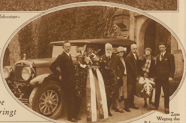
Zum Wegzug des