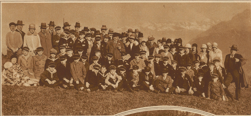
Der Berliner Domchor auf seiner Schweizer-Konzertreise in Davos