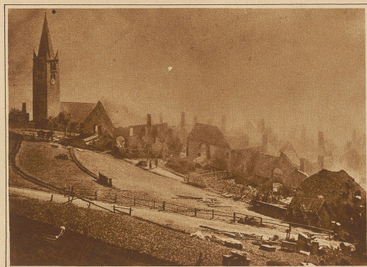
Eine gewaltige Feuersbrunst zerstörte das Dörfchen Puy St-André bei Briançon in den französischen Alpen. Dem in einer Epicorerie entstandenen Brand fielen 80 Häuser zum Opfer

Polenmuseums aus Rapperswil. Ueberführung des Herzens des polnischen Freiheitshelden Kosciuszko aus dem Schloß Rapperswil an den Bahnhof