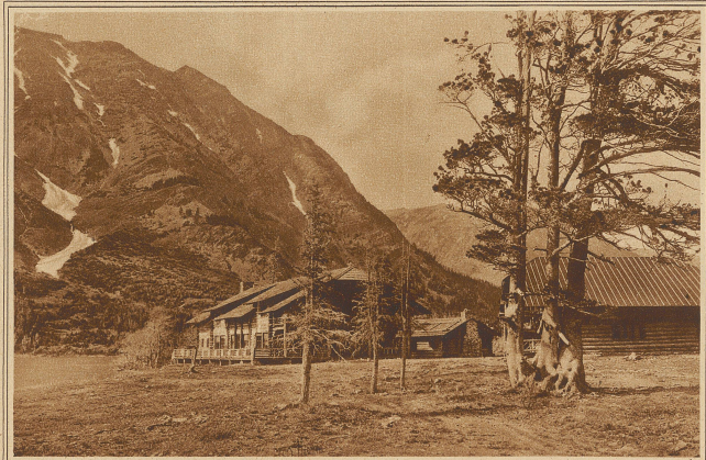
Von der Bahngesellschaft erbaute Ferienchalets