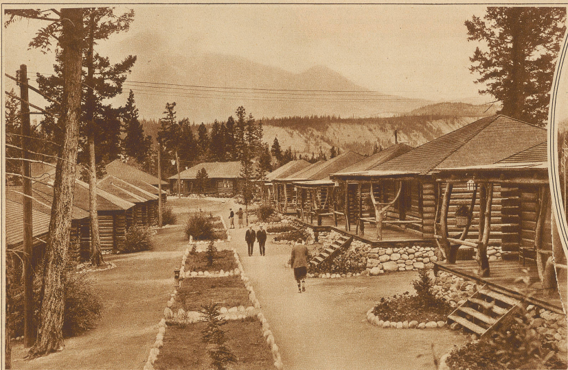
Eines der typischen Feriedörfer im Jasper Nationalpark