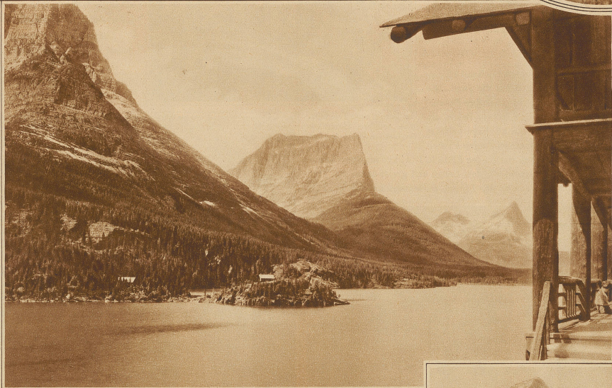
Blick auf den «Little Chief» und «Citadel Mt.» von den Sun Chalets im Glacier Nationalpark aus

Zeitungen, Zeitschriften und Bücher finden in der Regel