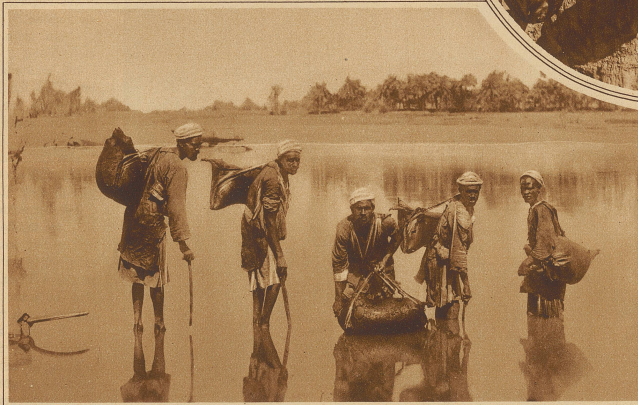
Links: Wasserträger am Nil

te sie mich nicht erkennen. Schließlich betrat sie den Lokalbahnhof, der dort liegt; ich zweifelte nicht länger. Ihr Liebhaber würde mit dem Zug um ein Uhr fünf- undvierzig eintreffen. / Ich versteckte mich hinter einem Lastwagen und wartete. / Ein Pfiff... ein Strom von Reisenden... Sie eilt nach vorn, drängt sich zwischen die Menge, hebt ein kleines Mädchen von drei Jahren empor und küßt es leidenschaftlich, eine Bäuerin steht daneben. Dann dreht sie sich um, ein anderes Kind steht vor ihr, das noch kleiner ist, Junge oder Mädchen, eine andere Frau vom Lande dabei. Sie nimmt es in die Arme und herzt es genau so. Schließlich geht sie mit den zwei Kleinen und den beiden Wärterinnen auf die lange düstere und einsame Promenade von Cours-la-Rein zu. Vollständig verwirrt mache ich mich auf den Heimweg. Ich wußte nicht aus noch ein. Ich begriff etwas und begriff wieder nicht, ich traute mich nicht, das Rätsel zu lösen. / Als sie zum Abendbrot zurückkam, stürzte ich heulend auf sie los: «Was sind das für Kinder?»