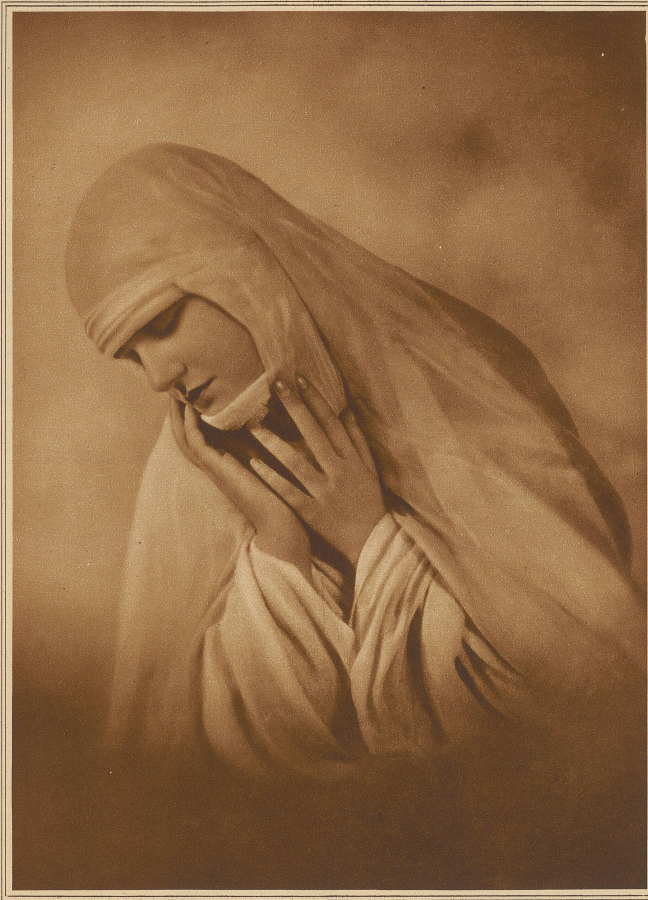
Allerheiligen — Allerseelen

Sie wurde geschraubt, nicht ohne Grazie. Ich bot ihr Champagner an, auch ich trank welchen; meine Gedanken verirren sich. Ich fühlte deutlich, ich würde unternehmend werden, und bekam Angst, Angst vor mir, vor ihr; sie könnte auch ein wenig bewegt werden und würde sich gehen lassen. Um mich zu beruhigen, fing ich noch einmal von ihrer Mitgift an. Man müsse sie auch ganz sicher anlegen, denn mein Klient sei ein Geschäftsmann.