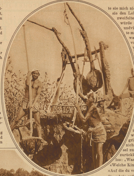
Wasserschöpfer in Oberägypten

Es war ein Dienstag. Ungefähr um eins ging sie fort, die rue de la Republique hinunter und weiter bis in den Westen der Stadt, ja, bis zu dem