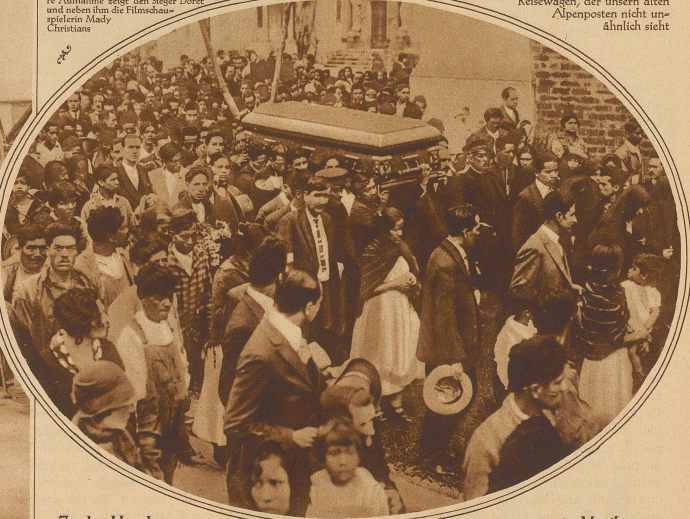
Zu den Unruhen in Mexiko. Das Begräbnis der Generals Serrano, der schon am zweiten Tage des Aufstandes hingerichtet und zur Abschreckung öffentlich zur Schau gestellt wurde