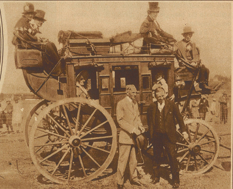
Bevor das Auto erfunden wurde, besaß auch der Automobilkönig Henry Ford eine Reisekutsche, die er jetzt als Antiquität auf der Eisenbahn-Ausstellung in Baltimore ausgestellt hat. Henry Ford steht vor dem Reisewagen, der unsern alten Alpenposten nicht unähnlich sieht