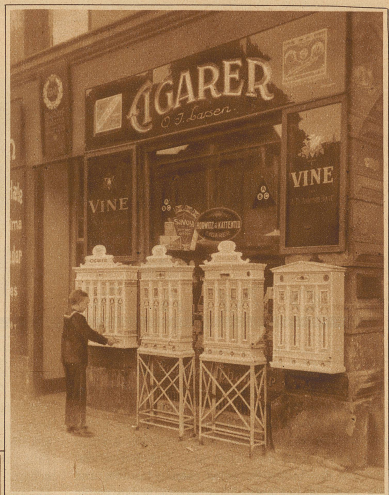
Bild rechts: Der Automat als Verkäufer nach Ladenschluß. In Kopenhagen kommt kein Raucher mehr in Verlegenheit. Die meisten Zigarrenhändler haben sich nämlich eine ganze Anzahl Automaten angeschafft, die während der ganzen Nacht u. den Sonntag über die hauptsächlichsten Sorten Zigarren und Zigaretten abgeben