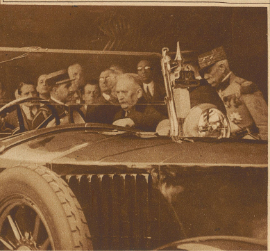
Zum Besuch des Königs Fuad I. in Paris. Der ägyptische König grüßt, während der französische Präsident Doumergue in den Wagen steigt