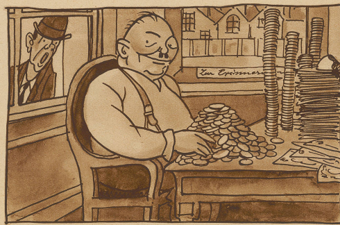
Das Benefiz der Wirtsausstellung

«Aha,» sagte einer am Tisch, «ich verstehe. Er suggerierte sich die Haare wieder weg.» «Nein, er starb an Alkoholvergiftung.»