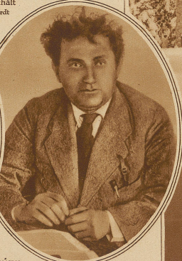
Troski und Sinowjew die beiden Führer der Opposition, die auf Antrag Moskaus aus der kommunistischen Partei ausgeschlossen wurden