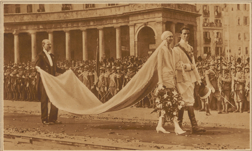
Aus der pompösen Hochzeitsfeier des Herzogs Amadeus von Apulien, eines Vettres des Königs von Italien, mit der Prinzessin Anna von Orleans. Das Brautpaar verläßt die Kirche in Neapel