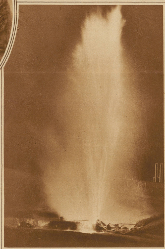
Die Riesenerplosion des Gaswerkes von Pittsburgh in Pennsylvania. Etwa 50 Personen wurden getötet und über 600 verletzt. In einer Distanz von 1/4 km fand man Stücke der Gasometer im Gewicht von 50 kg. Hunderte von Häusern liegen in Trümmern