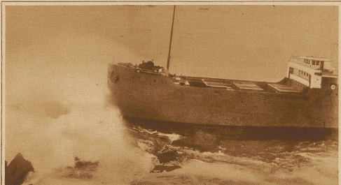
Die letzten Stürme im Pacific haben wieder zahlreiche Opfer gefordert. So wurden u. a. zwei Schiffe auf die Felsenriffe von Lands End bei San Francisco geworfen. Unser Bild zeigt im Vordergrund ein festgefahrenes Transportschiff und im Hintergrund einen gestrandeten Segler, dem durch ein Dampfschiff Hilfe gebracht wurde