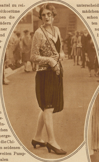
Der Damenskoking des Jahres 1928

Von Amerika aus kam die Sitte der Damen, im Herrensattel zu reiten, und heute ist es allgemein gebräuchlich. Damenreitkostime mit Breeches anzufertigen. Zum Wintersport erscheinen die Damen in Knickerbockers, und in amerikanischen Seebädern absolvieren sie ihre Morgenspaziergänge am Strand in einer Art von Trikotbeinkleidern, zu denen Halbschuhe und Sportstrümpfe getragen werden. Interessant ist die Gründung mehrerer Klubs in Amerika, die eine neue billige Mode dadurch zu propagieren suchen, daß sie ihre weiblichen Mitglieder verpflichten, nur einheitliche Hosenkostüme zu tragen. Sie versuchen diesen «Einheitsanzug», der aus Hose mit Weste besteht, als dauernde Einheitstracht auf der Straße durchzusetzen, und ihre Mitglieder müssen sich — echt amerikanisch — verpflichten, täglich in dieser Hosentracht einen Spaziergang über den Broadway zu machen, um zur Nachahmung anzuregen. Was unseren Frauen als Moderevolution erscheint, finden wir bei exotischen Völkern als Althergebrachtes. So trippelt die Chinesendame in langen seidnen Beinkleidern. Die weiten Pump-hosen der Orientalen sind uns wohlbekannt. Im hohen Norden tragen die Lappenfrauen richtige Hosen aus Seehundsfell, die sich in nichts von denen der Männer