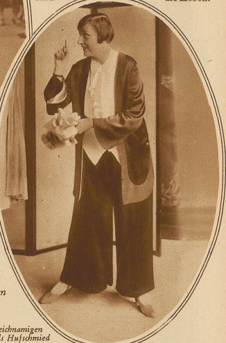
Bild rechts: Amüsanter Smokinganzug mit weiten, plissierten Hosen

unterscheiden; ebenso gehen die Tiroler Bauernmädchen und teilweise auch unsere Walliserinnen schon seit altersher ihren ländlichen Arbeiten in Hosentracht nach. In Europa herrscht noch immer der Rock, und die «Uaussprechlichen» sind vorläufig nur beim Sport erlaubt. Aber wenn die Vermännlichung der Frau weitere Fortschritte macht — wer weiß — vielleicht folgen nach Herrenschmitt, Umlegekragen und Krawatte bald — die Hosen.