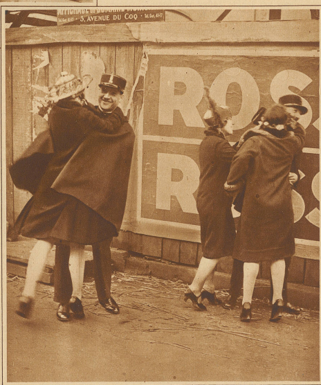
Selbst die Verkehrspolizisten sind vor den Angriffen der Midinetten nicht sicher