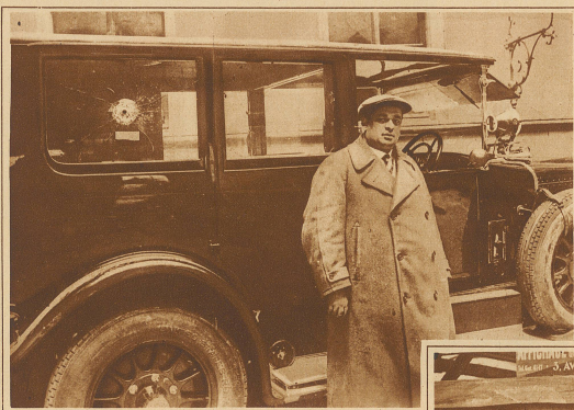
Das Auto des Bürgermeisters mit der Durchschußöffnung