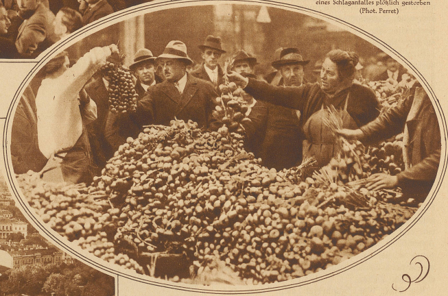
Der Bärner Zibelmärkt