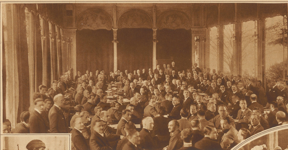
Die Eröffnungssitzung der vorbereitenden Abrüstungskonferenz in Genf