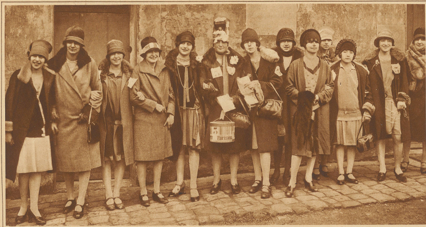
Die siegreichen Läuferinnen des Preises der heiligen Katharina