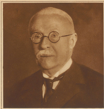
Nationalrat Otto de Dardel, der während 12 Jahren auch der Zunft der Zeitungsschreiber angehörte, ist am den Folgen eines Schlaganfalles plötzlich gestorben