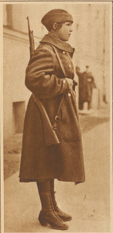
Ein weiblicher polnischer Soldat in Wilna