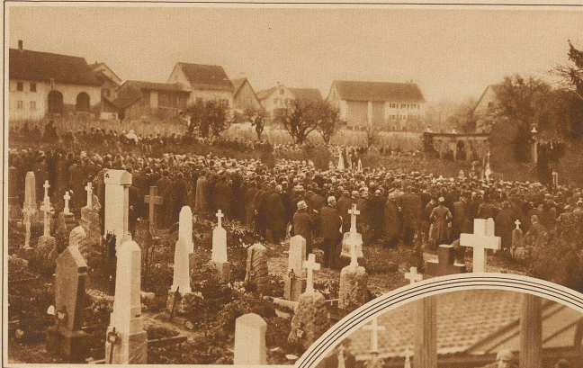
Die Abdankung auf dem Friedhof