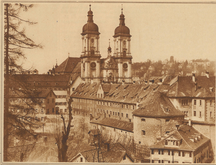
Die Stiftskirche St. Gallen, von Osten gesehen

Die eigentliche Klosterzeit von St. Gallen umfaßt die Zeit von 720 bis 1798 oder mit andern Worten: sie dauerte von der Gründung des Klosters durch Othmar (der die kirchliche Siedelung des irischen