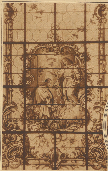
«Maria Empfängnis», ein Chorfenster im Mittelschiff

Die künstlerische und literarische Blütezeit begann mit dem Abt Cozbert (816-837), der sich durch die Gründung der heute noch berühmten Stiftsbibliothek unsterbliche Verdienste erwarb. In der Schreibschule des Klosters entstanden Werke von unbeschreiblicher Schönheit, ausgeführt mit einem geradezu unfaßbaren Fleiß und mit einem auseresenen Geschmack. Zweimal begegnet man da einem Mönch mit dem Namen Notker. Zuerst dem Musiker und Musiktheoretiker mit dem Beinamen Balbulus (der Stammeler) 830-912, von dem ein Chronist sagte, er sei in seiner