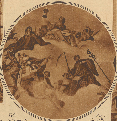
Teilstück aus dem