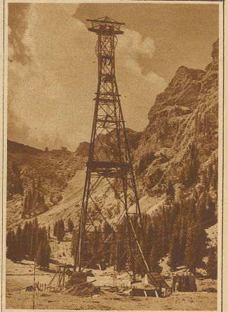
Die 63 m hohe Tragsäule 3 im Bau. Zwischen dieser und der nächsten Säule beträgt die Spannweite der Tragsäule 1045 m Die erste schweizerische Schwebbahn von Gerschnialp auf Trübssee ist am Samstag in Engelberg offiziell eingeweiht worden. Die Laufbahn hat eine Länge von 3285 m und die Steigung beträgt 551,8 m. Mit dieser Bahn erhält Engelberg einen neuen Anziehungspunkt als Kur- und Sportplatz, denn sie bietet Gelegenheit, mittels der hochalpinen Skifelder auf Trübssee zu erreichen