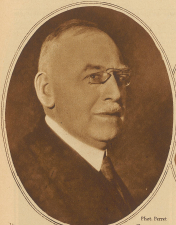
Phot. Perret Pierre Favarger der Kandidat de Dardels im Nationalrat. Die Validierung seiner Wahl führt zu einer Ordensdebatte, da Favarger Ritter der franz. Ehrenlegion ist, und nach Bundesverfassung das Tragen eines Ordens mit der Ausübung des Nationalratsmandates nicht vereinbar ist