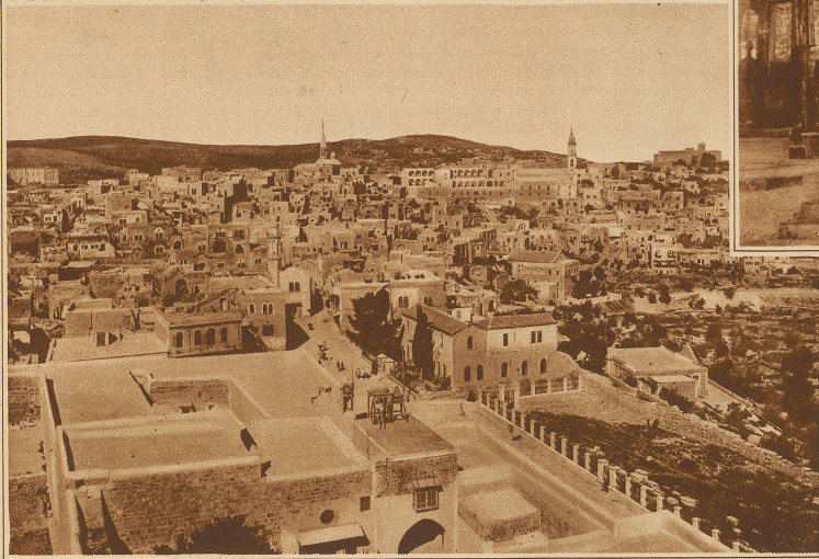
Blick auf die Stadt Bethlehem

plünderte, Männer aus Italien und der Provence sich in Bethlehems Sonne wohl fühlen und Menschen aus dem inneren Asien durch die Gassen schritten und in ihr Heimat priesen, sie blieb doch all die Jahrtausende hindurch die kindliche, die feine edle Stadt, wo ein hauchfeiner sagenhafter Mythos nicht sterben wird. Man-