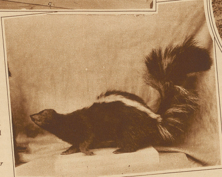
Rechts: Skunks oder Stinktier