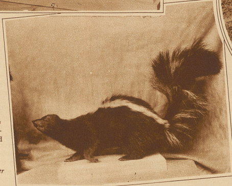
Rechts: Skunks oder Stinktier