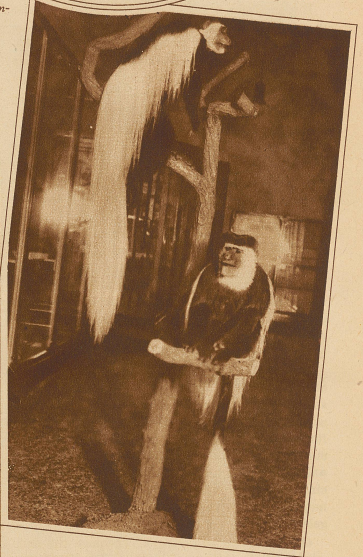
Weißschwanz-Seidenaffen Das langhaarige Fell findet zur Bezeugung feiner Damenmäntel Verwendung

Ein Taumel, ein Fest, Terrassen voll Glanz, Ein Rauschen und Schweben, Musik und Tanz, Und verlabtes Flüstern: „O Königin!“ Ich lese Fritzecken-in-Männerblicken, Doch spiele ich nur mit dem Herzen lechthirn