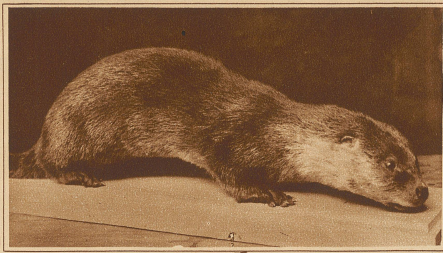
Fischotter Der Pelz dient hauptsächlich zu Kragen feiner Herrenpelze

Peter beobachtete den Kriminalkommissär mit liebenswürdigem Interesse, während dieser seine Fingerabdrücke mit einer mitgebrachten Probe verglich. Er unterschätzte die Intelligenz des Kriminalkommissärs durchaus nicht und war sich vollkommen darüber klar, daß er in bezug auf Hilmers Anklage nicht so völlig von deren Unwahrscheinlichkeit überzeugt war, wie er tat. Hilmers Behauptung klang phantastisch, aber es bestand doch eine, wenn auch sehr geringe Möglichkeit, daß Peter in einem Anfall von Abenteuerlust in eine solche Geschichte geraten wäre, um einem Freunde zu helfen. Und obwohl alle tatsächlichen Umstände darauf hindeuteten, daß der Einbruch zu einem Zeitpunkt verübt worden sei, da Peter ebenso wie auch Wasiliew sich an ganz anderer Stelle in einer Gesellschaft befand,