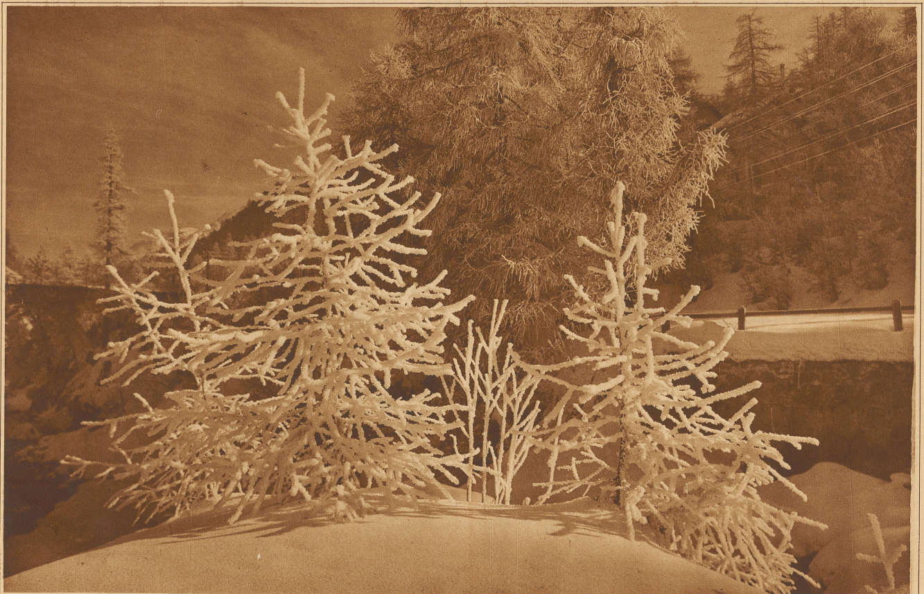
Christbäume im Rauheis

Sollte es mir nicht glücken, irgendeine Spur zu finden, die uns zur Hoffnung berechtigt, die Sache aufzuklären, so würde ich meinen Vorgesetzten gegenüber es nur schwer rechtfertigen können, nicht allen erhaltenen Hinweisen, seien sie auch noch so wahnsinnig, nachgegangen zu sein. Wenn Sie es mir nicht übelnehmen, würde ich großen Wert darauf legen, mir einen unbedingt entscheidenden Beweis dafür verschaffen zu können, daß Hilmers Beschuldigungen gegen Sie völlig aus der Luft gegriffen sind. Sie ver-