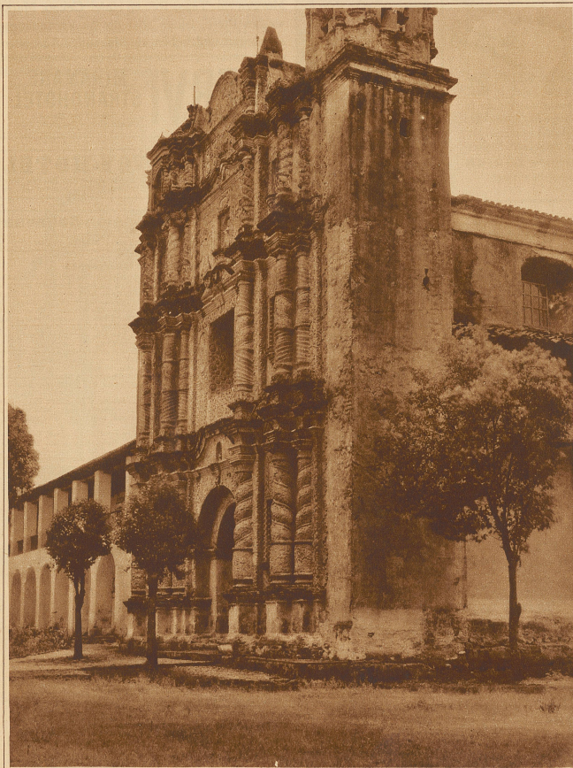
Die Kirche San Domingo in Chiapas mit ihren prächtigen architektonischen Formen. Sie trägt auf der Vorderfront noch das alte habsburgische Wappen

Dann kommt ein Abend, an dem sie ihre Gesichter einander zukehren. Sie lächeln und kichern und schluchzen. Aber zu sagen haben sie sich nichts. Sie fühlen sich nur glücklich darüber, daß sie sich gefunden haben, daß sie sich verstehen, daß sie sich lieben und einer von andern alles haben kann, was er wünscht. Das geht vielleicht auch ein paar Abende so hin, je nach der Widerstandskraft, die sie jetzt noch haben, die aber nun kräftig anfängt nachzulassen.