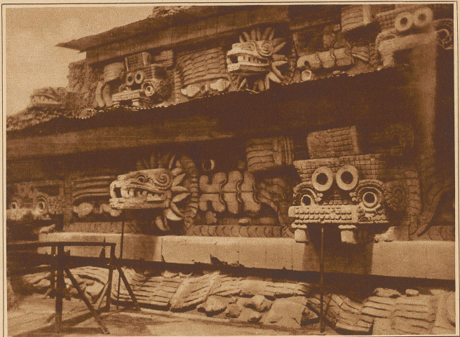
Ein Teil der Pyramide des Gottes Quetzalcoatl. Die Verzierungen zeigen die hochentwickelten Fähigkeiten altindianischer Künstler Zentral-Mexikos

Dann kommt er am nächsten Abend wieder einen Schritt näher, und bleibt sie immer noch sitzen, so heißt das, er ist willkommen als Freier. Endlich sitzen sie nur noch drei bis vier Schritte getrennt von-