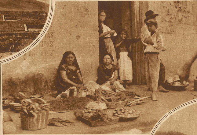
Nahoas-Indianer bieten auf dem Markte ihre Waren an. Die an der Mauer sitzende Frau trägt die farbenreiche und geschmackvolle Tracht der Tehuantepeken

Sie sitzen da und kehren einander ihre Rücken zu, nicht ihre Gesichter. Er rückt jetzt ein wenig