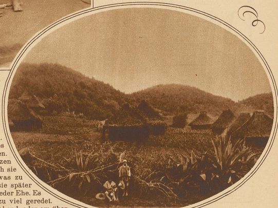
Chamula, die «Hauptstadt» der Chamula-Indianer. Die Aecker, bei den Häusern gelegen, sind gepflügt wie Gärten

sagt nichts, sie sagt nichts. Aber beide fühlen sich sehr glücklich, so glücklich, wie sich nur irgendwo auf Erden zwei glücklich Verliebte fühlen können. Denn diese Tage und Wochen sind die süßeste Liebeszeit ihres Daseins, sie sind der Höhepunkt aller Gefühle, die der Mensch in Dichtung und Musik auszudrücken sucht und doch niemals wahrhaft ausdrücken kann. Es ist die Zeit der Menschen, echten, herzlichen Liebe zweier junger Menschen vor der Erfüllung, die die erste Dissonanz in die Harmonie der reinen wunschlosen Liebe bringt. Die Köstlichkeit dieser Liebeszeit wird vertieft dadurch, daß beide jetzt wissen, daß, wenn der Wunsch ausgesprochen wird, er seine Erfüllung findet. Und daß keiner ihm ausspricht, sondern daß sie schweigend und sinnend Rücken an Rücken gegeneinander sitzen, erfüllt sie mit unnenbarer Seligkeit. Sie fühlen sich wohl und warm und gebor-