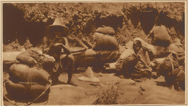
Lasten von 40-80 kg tragen die Indianer über die steinigten Gebirgspfade und über die von der tropischen Glut geröstete Steppe, 30, 40, 50 km weit an einem Tage, ohne die geringste Ermüdung zu zeigen