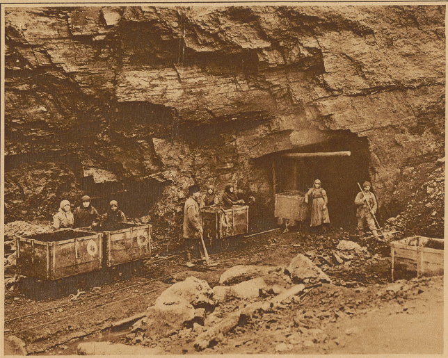
Am Eingang in eine Kohlengrube

Die Konsolidierung der wirtschaftlichen Verhältnisse in Polen schreitet unaufhaltsam fort und die Zeit dürfte nicht mehr fern sein, wo der Vorkriegsstand auf den meisten Gebieten des wirtschaftlichen Lebens erreicht sein wird. Dann wird Polen wieder ein bedeutender Abnehmer schweizerischer Industrieerzeugnisse werden, wie es vor dem Kriege war. Aber nicht nur als Abnehmer schweizerischer Waren ist Polen von Interesse für uns. Auch als Lieferant verschiedener Rohstoffe von vorzüglicher Qualität kommt Polen für die Schweiz in Frage. S. A.