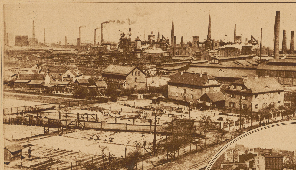
Królewska-Huta, das Zentrum der oberschlesischen Kohlenindustrie