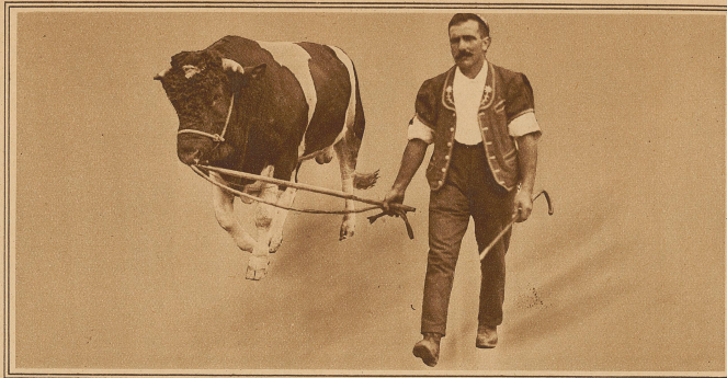
Landestruer im Tierreich. Mit der Ueberschrift «Hans ist tot» hat eine Berner Zeitung vor einigen Tagen folgende Trauernachricht gebracht: Nicht irgendein sorglich behüteter Kanarienhans ist vom Stengel gefallen, sondern der Stolz der Simmentaler Rindviehacht, der Züchter «Hans», ist im Alter von sechs Jahren einem Herzschlag zum Opfer gefallen. Dieser «Hans» war eine Berühmtheit in den Schweizerlanden und das Preisstück an der Berner landwirtschaftlichen Ausstellung neben seinem Rivalen «Wächter». Um die Vorzüge beider wurde ein ebenso erbitterter wie fröhlicher Federkrieg geführt. «Hans» hinterläßt 81 in den Zuchtbüchern eingetragene legitime Söhne, von denen etliche gleichfalls Aussicht haben, zu hohem Ansehen zu gelangen

«Hastings mit 413 Frauen an Bord abgefahren stop Diese sind zugeteilt den ersten 413 Männern Ihrer Liste A stop Bei Ankunft der