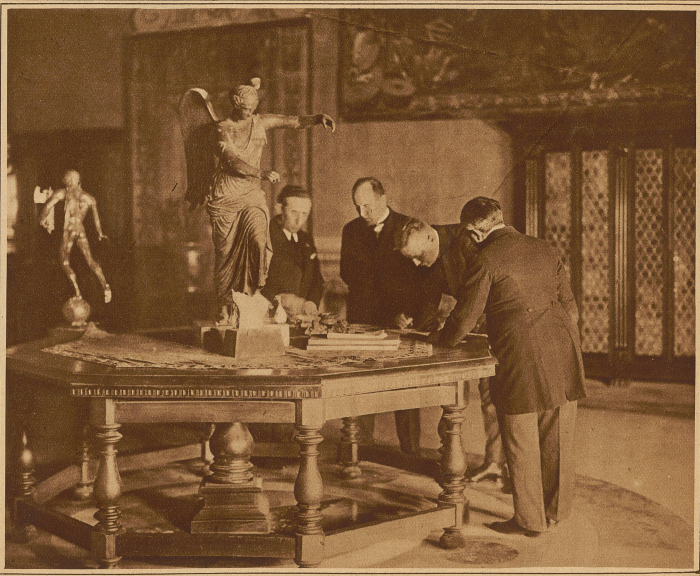
Die Unterzeichner des deutsch-italienischen Vertrages