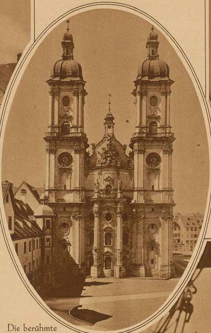
Die berühmte Kathedrale von St. Gallen erfährt dieses Jahr eine Außenrenovation