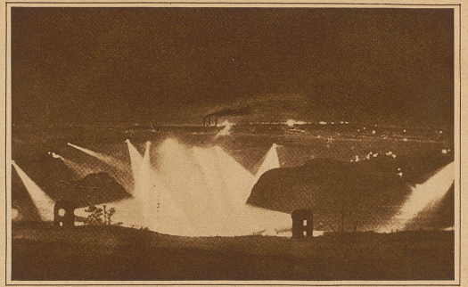
30 Scheinwerfer beleuchten nachts die Diamantenmine

brückbar von der Außenwelt abgeschnitten ist, wie das Direktionszimmer mit dem Diamantensafe. Verlassen sie die Umzäunung, dann werden sie zuerst einer Untersuchung unterzogen, von der man sich in Europa kaum einen Begriff machen kann. Man beschränkt sich durchaus nicht darauf, den Mann völlig auszuziehen, ihn körperlich zu untersuchen und die Kleider durch eigene Beamte und Tastmaschinen schnell, aber gründlich, auf den vielleicht eingesähten Stein abzufühlen. Jeder, der geringen Anlaß zum Verdacht geben könnte, wandert in das Röntgenkabinett. Da kann kein Missetäter seinem Schicksal entgehen! Eine sinnreiche Anordnung der Gebäude hat im Röntgenraum auch eine eiserne Tür eingelassen, von der aus ein bequemer Gang gleich in das danebenliegende Separatzuchthaus führt. — Allerdings: die Schwarzen sind fündig im Schaffen neuer Möglichkeiten, unbemerkt einige dieser kostbaren Steine aus dem Minenbezirk herauszubekommen. Unter der Kopfhaut, in eingeschnittenen Wunden, in künstlichen Zähnen, wird heutzutage niemand mehr Steine verstecken wollen. Besonders «schlau» war ein Neger, der sich ein Auge ausriß, ein Glasauge einsetzen ließ und dieses beim nächsten Urlaub als Gefäß für einen ganz großen Diamanten verwandte. Aber der arme Kerl wurde erwischt. Sein Märtyrertum war umsonst und er hatte mit seinem einen Auge das