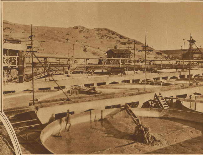
Das diamanthaltige Gestein wird in große Schwemmbehälter gebracht

in denen man Diamanten auf der Oberfläche findet, wie in Australien oder Südwestafrika, wo einem heute noch mitten in der Wüste aufgestellte Schilder begegnen, die in unserer Großstadt kein schlechter Scherz wären: «Es ist bei strenger Strafe verboten, auf der Erde liegende Diamanten mitzunehmen!» Nein, die eigentliche Heimat der Diamanten sind die gewaltigen Minen in der Nähe von Kimberley und Pretoria, die zusammen allein über 90% der Weltproduktion innehaben, und aus deren schwarzen Schloten gewaltige Maschinen gigantische Gesteinsberge ans Tageslicht fördern, zu Staub zermahlen und der eigentlichen Fabrik zuführen, die das Sortieren der Diamanten besorgt. Am interessantesten ist zweifellos die größte Diamantenmine der Welt, die Premiermine bei Pretoria. Sie ist die einzige, in der die Diamanten hoch