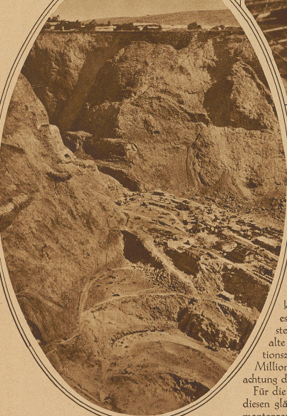
Blick in die größte Diamantenmine der Welt: die Premier-Mine bei Pretoria

Noch immer stecken unermeßliche Reichtümer in dem wohl unerschöpflichen Vorrat von Diamanten, den der Sand Südafrikas birgt, und lange