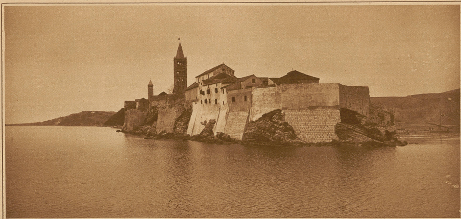
Ein trübses Stück Mittelalter: Das Städtchen Arbe auf der gleichnamigen Insel