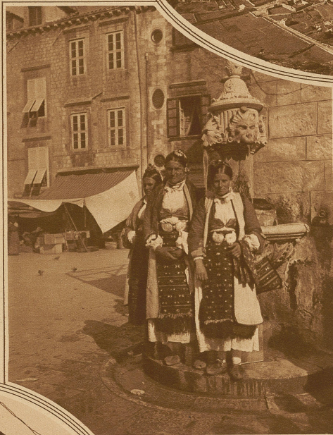
Mädchen aus der Krivovisc (Hinterland der Bucht von Cattaro) als Marktbesucherinnen in Ragusa

Selbst auf den Inseln, wo es sich am längsten erhielt, ist es durch das Kroatische verdrängt worden und heute ist infolge der politischen Rivalität zwischen beiden Nationen der Trennungstrieb noch schärfer gezogen. Der fremde Besucher wird diese internen Gegensätze kaum gewahr, denn er begegnet fast durchwegs einer freundlichen Zuvorkommenheit und weitgehenden Gastfreundschaft, die von der lukrativen Ausnützung fremder Reiselust noch wenig weiß.