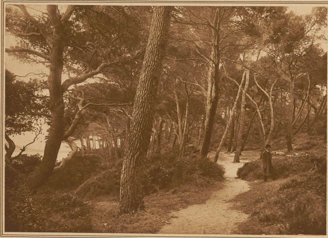
Pinienwald auf der Insel Lacroma bei Ragusa. Man beachte die schiefe Stellung der Bäume als Folge der konstant aus der gleichen Richtung wehenden Winde

gangenheit und einer vielleicht nicht minder bedeutungsvollen Zukunft, ein Land voller Schönheit und Sonne, bewohnt von einem prächtigen und interessanten Menschenschlag, verkürt vom Schimmer einer wildbewegten Geschichte, in der