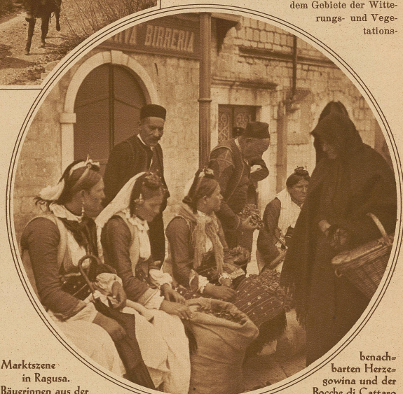
Marktszene in Ragusa. Bäuerinnen aus der