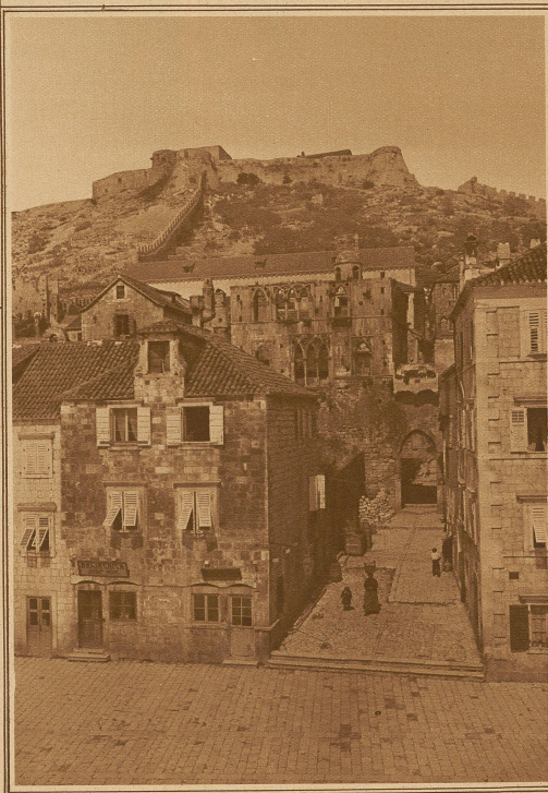
Verfallene venetianische Paläste in Lesina