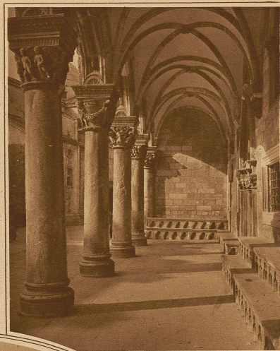
Inneres der Säulenhalle am Rektorenpalast in Ragusa

Bekannt ist der Weinreichtum der dalmatinischen Inseln, deren Produkte von ausgezeichnete Qualität sind. Ueberhaupt ist der dalmatinische Bauer ein ebenso geschickter wie geduldiger Landwirt, der vielfach noch mit den primitivsten Mitteln jedes kleinste Fleckchen Erde liebevoll bearbeitet und den Boden zur Fruchtbarkeit zwingt. Das Lebenselement des Dalmatiners, wenigstens in seiner Jugend, ist aber die Seefahrt; mit dem Meer ist er von Kindesbeinen an verwachsen und seit zwei Jahrtausenden liefern die Dalmatiner die Besatzungen der seefahrenden Nationen am Mittelmeer.