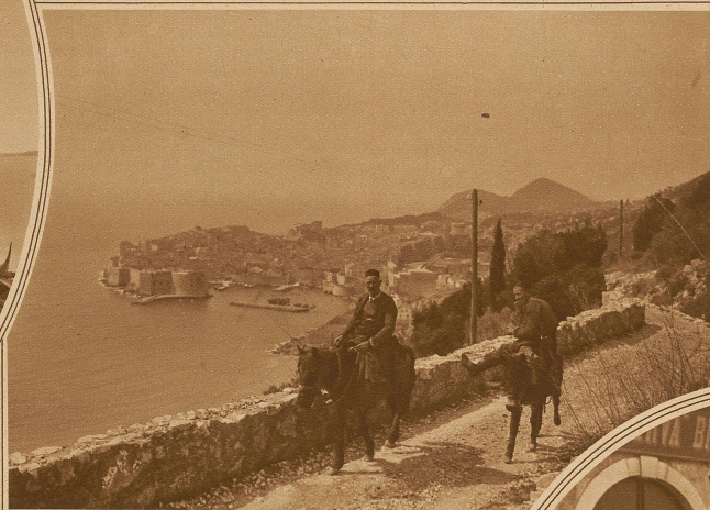
Vom Markte in Ragusa heimkehrende Bochesen

Man kann heute auch in Europa noch Entdeckungsfahrten machen, die den Drang nach Unbekanntem und Seltsamem, nach Roman-