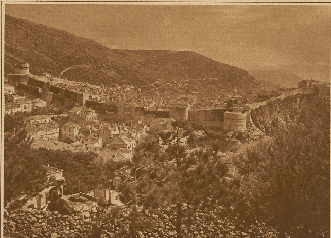
Ragusa von Norden her gesehen. Im Vordergrund die starke Stadtumwallung aus dem XV. Jahrhundert, links oben die gewaltige Bastion Mincetta, rechts außen das alte Fort San Lorenzo, das 1050 von der Bürgerschaft zum Schutze gegen die Venetianer erbaut wurde

unnatürliche Aufteilung des Landes nach dem Weltkriege zeigt.