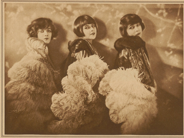
Die drei Schwestern Gulchrain

hart an die Grenze, wo das «Never-Never-Land» beginnt.»