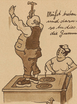
Müsst haken Du auf eine glatte und daru noch geheirte Platte so tu dies ruhig nur, mein Sohn, die Gummischeln schickst schau.