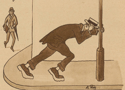
Doch siehst Du Deinen Schneider nah und willst die Flucht beginnen, versuch es nur, Du gleitest aus! Da gibt es kein Entrinnen!!