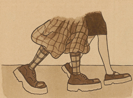
Die Gummischeln sind modern von Mädels, Tamen & von Herrn und werden gern getragen an Sonn- und Regenagen.