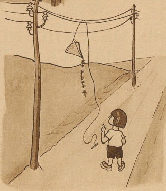
Greif nach der Leitung umvorherholst nichts hast Du zu riskieren Du trägt ja Schuh mit Gummischeln Was kann Dir da passieren?!