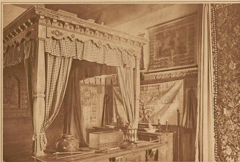
Die Reuterkammer. Dieser kleine, schlichte Raum, mit dem großen, reich geschnittenen Himmelbett, birgt als Hauptzierde den prächtigen «Allianzeteppich»-Muntprat Alheim.

Ruine übriggeblieben ist. Machen wir nunmehr der alten Ritterburg Altenklingen einen Besuch und lassen uns von ihr aus seiner Vergangenheit etwas erzählen.