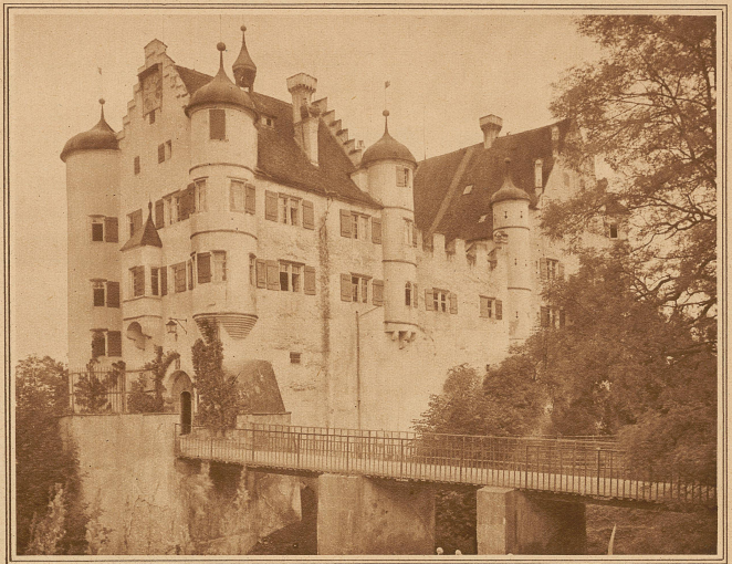
Ansicht der Ostfront und der Zugangsbrücke

Den einst so stolz in die Lande hinausschauenden Schlössern setzten die verfloßenen Jahrhunderte zum Teil in arger Weise zu, so daß von manch herrlicher Ritterburg ein klägliches Gemäuerrest oder gar nicht einmal ein Fragment einer