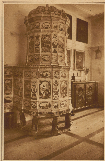
Schaffhauserstube. Die Hauptzierde besitzt die Schaffhauserstube in dem großen, buntemalten Kachelofen, der von sechs stehenden Löwen getragen wird. Der Ofen stammt aus dem Jahre 1781

Seit der Uebernahme des Schlosses im Jahre 1585 durch Junker Leonhard Zollikofer blieb