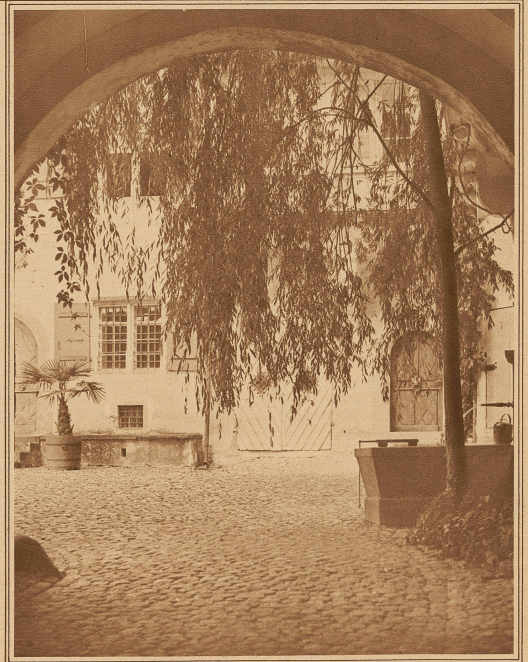
Malerischer Durchblick in den Schloßhof