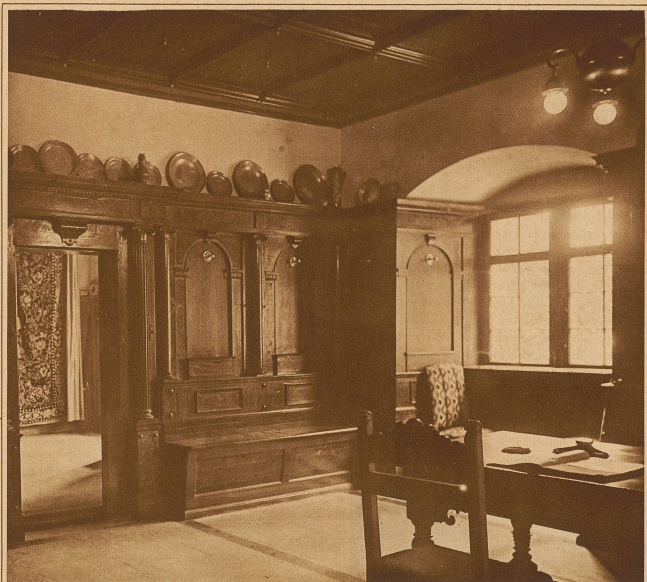
Reuterstube mit Blick in die Reuterkammer mit dem Allianzteppich (Fortsetzung von Seite 4)

Ein anderer Walther besiegelte seine Treue mit dem Tode in der Sempacher Schlacht anno 1386, gegen das Haus Habsburg.