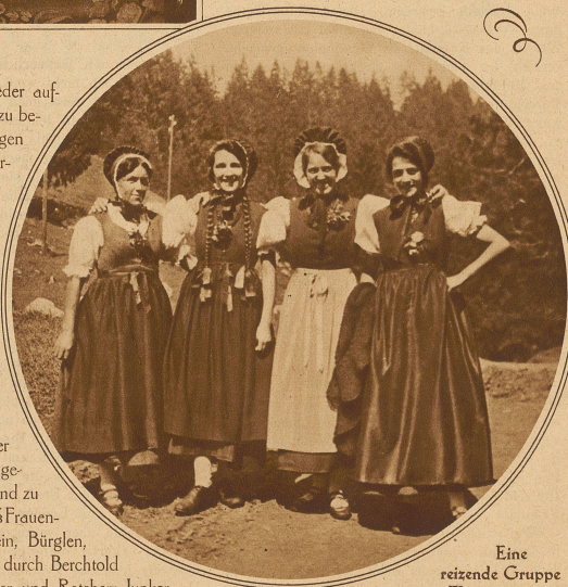
Eine reizende Gruppe junger Thurgauerinnen

Die Inneneinteilung bietet dem Beschauer den großen Treppenaufgang, Rüstkammer, Reuterstube, Reuterkammer und im ersten Stock Kapellstube, Kapellkammer, Nordstube und Junkerstube und im zweiten Stock den höchst sehenswerten herrlichen Ritter- oder Ahnensaal, die Saalstube und Kammern, Schaffhauserstube und Schaffhauserkammer usw. und ganz speziell den jeweiligen interessanten Vorplatz, der zu den schönen Gemächern Eingang verschafft und höchst sehenswert ist.