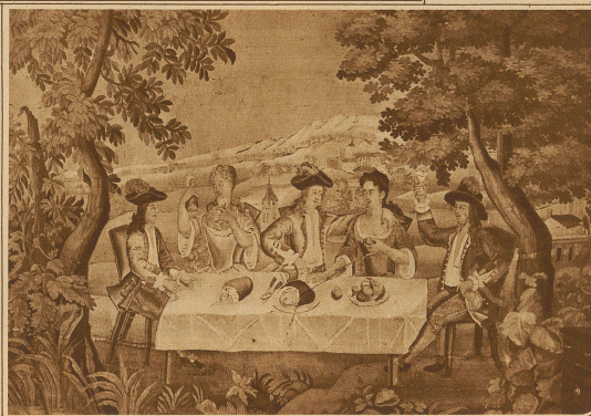
Cobelin: Ein Gelage im Freien

und Appenzellern erstürmten Burgen sind auch nie wieder aufgebaut worden. Es war als eine besondere Vorsehung zu bezeichnen, daß gerade das herrliche Schloß Altenklingen unzerstört aus der blinden Wut der Vernichtung hervorging, sonst wäre auch hier wie anderorts statt der herrlichen Ritterburg ein öder, wildverwachsener Burgstock zu finden gewesen. Aber nicht allzulange blieb die Freiherrschaft Altenklingen im Besitz der Herren von Enne, denn im Jahre 1419 gelangte sie durch Kauf an die Leutfried und Hanns Muntpradt, eines angesehenen konstanzischen Patriziergeschlechtes, das im Thurgau große Besitzungen zu eigen hatte, und es sind namentlich Spiegelberg und Lommis, und diese Herren besaßen Altenklingen nur 22 Jahre lang. / Im Jahre 1441 gelangte es wiederum an die Herren von Breitenlandenbergr, welche die Reichbegütertesten zu selber Zeit im Thurgau gewesen sein sollen. 118 Jahre lang gehörte Altenklingen diesen angesehenen Landenbergern und zu diesen Besitzungen gehörten außerdem Zürichgau, Schloß Frauenfeld, Arbon, Bichelsee, Herdern, Wellenberg, Salenstein, Bürglen, Hagenwil usw. / Im Jahre 1585 gelangte Altenklingen durch Berchtold Brymsi samt Gerichten an den st. gallischen Patrizier und Ratsherr Junker Leonhard Zollikofer, den Stammvater des heutigen Schlosses, welcher die alte