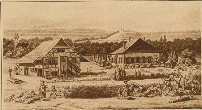
Der Neuhof bei Burgdorf

Pestalozzis brennende Herzensgüte, seine Liebeskraft, sein tragisches Leben stellen ihn heute, hundert Jahre nach seinem Tode, wie einen mythischen Helden vor jeder Seele auf, der Erziehung kein leeres Wort ist. Seine Schriften sind Bergwerke. Wo sie befahren werden, leuchtet aus großen Blöcken das Gerechte und Gute. Für manchen ist die Helligkeit der Metalle zu unerträglich, zu nackt! Ja, man muß Mut haben zu Pestalozzi — zu seiner Intransigenz, seiner Wildheit. Der Historiker des französischen Volkes, Michelet, hat recht, wenn er sagt: «Rabelais erzog einen König, Montaigne einen Fürsten, Locke und Rousseau einen Edelmann, Pestalozzi aber erzog die Menschheit.» Seltsam genug: denn Pestalozzi wollte nur sein Hänschen erziehen. Aber beim Kleinsten anfangend, hat er — fast wider Willen — seine Hand zum größten Schachbrett der Erde erhoben.