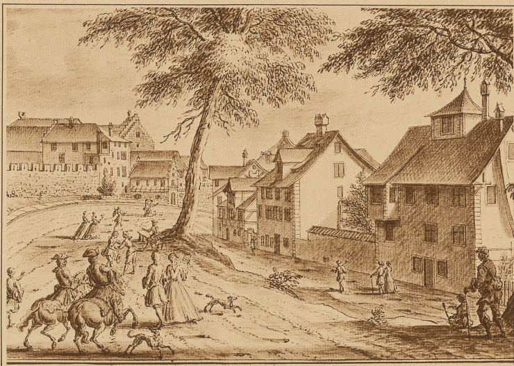
Pestalozzis Geburtshaus vor dem Lindentor (heute oberer Hirschengraben) in Zürich In einem dieser Häuser wurde Pestalozzi am 12. Januar 1746 geboren

heute recht einfach hin!), das bedeutete einmal eine geistige Revolution. Eine Revolution gegen den Gedankenboden, dem Pestalozzi selber entstammte und dem er recht eigentlich die wundervolle und leidenschaftliche Unbeschei-