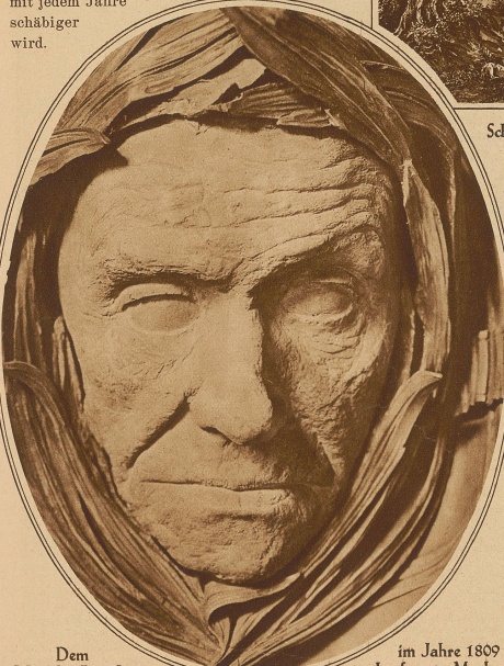
Dem lebenden Pestalozzi

Grunde beschränkt. Seine Wirksamkeit durch das Wort aber ist noch heute schrankenlos. Sie ist in der Tat unendlich und ewig. Man wird Pestalozzi nicht gerecht, wenn man den Grund jener Wirksamkeit leugnet. Es hilft nichts: dieser Mensch war ein Dichter! Und nicht nur einer jener großen Dichter — wie etwa der Entdecker Amerikas oder der Erfinder des Blitzableiters — dichterische Naturen waren, bei denen die innere Schau der Tat vorausging, — nein, Pestalozzi war im Sprachsinne Dichter, ein Kenner und Musikant des absoluten Wortes. Er war ein Tiefen-Wortträger, genau wie Herder oder der mittlere Goethe. Daher seine Gewalt über Menschen, die ihn nie