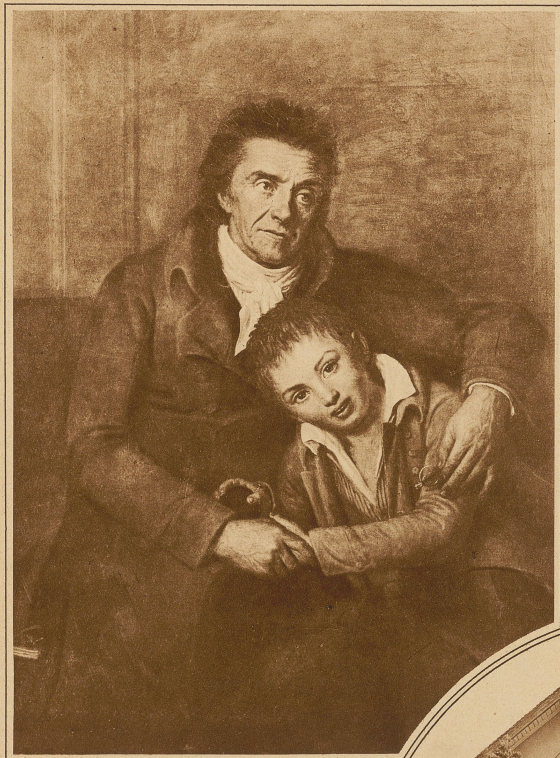
Pestalozzi mit seinem Enkel Gottlieb

Nach einem Gemälde von Schoener in der Zürcher Zentralbibliothek