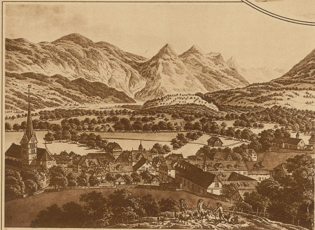
Nach einem alten Stich im Pestalozzianum in Zürich