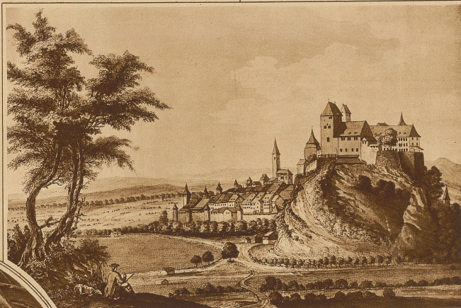
Schloß und Städtchen Burgdorf zur Zeit Pestalozzis

Die Wärme des Mutterleibes soll dem Kind auch nach der Geburt nicht entrisen werden! Die Keimzelle jedes Menschenlebens hat die Familie zu bleibend Heilig ist das Herdfeuer — widersinnig jede Vereinigung, die das Herdfeuer mit den einfachen Symbolen des Brotbrechens und Spinnens nicht kennt. Widersinnig ist vor allem die Schule als eine Lehr- und Lernvereinigung ohne Zärtlichkeit. Wenn die Schule sein will, muß sie zum Mutterprinzip zurückkehren, muß die Wohnstube werden, muß sie für alle Kinder durchaus das tun, was im Hause die Mutter für die eigenen Kinder tut... Wenn Pestalozzi in tausend Sätzen, in immer neuen Variationen diese Dinge vorbringt, dann ist er tausend Jahre alt. Er kennt das Leid der Mütter, denen man ihre Lieblinge entreißt, um «brauchbare Menschen» aus ihnen zu machen. Er weiß, daß diese brauchbaren Menschen in kurzer Zeit von der Welt verbraucht sein werden, und daß auch sie in kurzer Zeit die Welt verbrauchen werden — die darum auch mit jedem Jahre schäbiger wird.