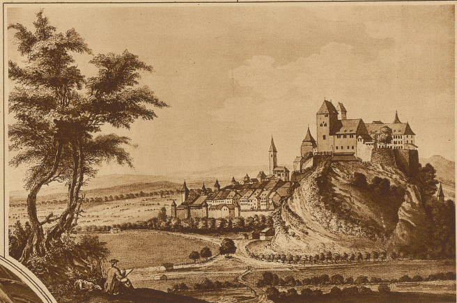
Schloß und Städtchen Burgdorf zur Zeit Pestalozzis