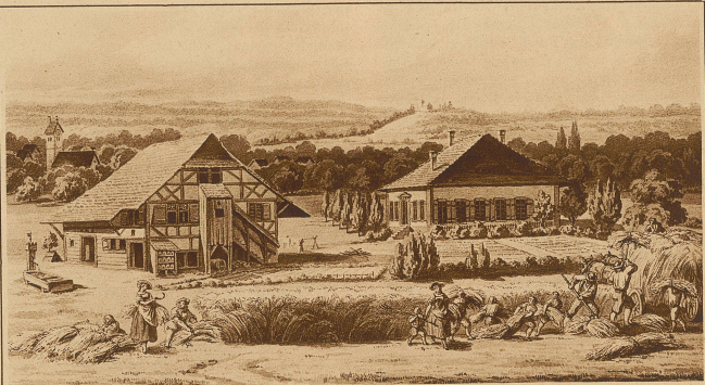
Der Neuhof bei Brugg

Pestalozzis praktische Wirksamkeit — er hielt sich für einen Organisator, ohne die Nerven eines Organisators zu besitzen — war im