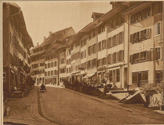
Die Hauptstraße in Brugg mit dem Sterbehaus Pestalozzis (rechts mit der Gedenktafel)

Eigentum der Gottfried Keller-Stiftung Phot. E. Linck