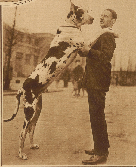
Prachtexemplar einer blau-weißen deutschen Dogge

(Aus Madras wird berichtet, daß unter den Kulis in ganz Südostasien die Trinkgewohnheiten im letzten Jahr außerordentlich rasche Fortschritte gemacht haben. Das populäre Getränk jener Gegend ist noch immer gegorener Palmwein, und es ist immer mehr üblich geworden, in den großen Plantagen besondere Palmenanpflanzungen zu reservieren, die ausschließlich das Getränk für die arbeitenden Kulis zu liefern haben. Die Tagesarbeit beginnt dann in der Regel mit dem Anzapfen der Palmen und dem Abfüllen des Saftes in Ochsenhäute, in denen er bis zum Abend ragt. Viele Kulis verbrauchen von ihrem durchschnittlichen Tagelohn von 2 Schill. 3 d nicht weniger als 1 1/2 Schill. für Palmwein.