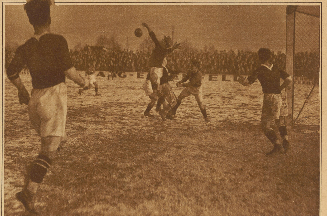
Maspolti bei einer seiner typischen Paraden