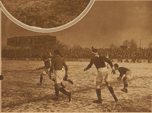
Kampfmoment vor dem Tor Luganos