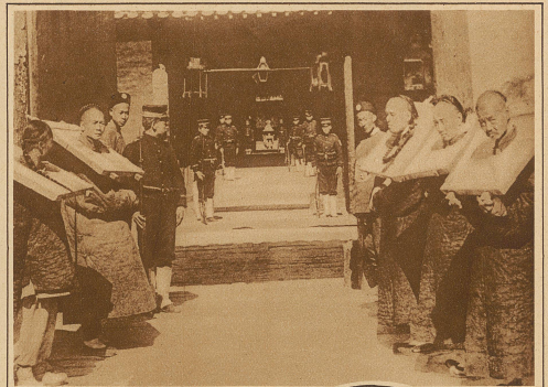
Die chinesischen Gefangenen werden teilweise heute noch mit mittelalterlichen Strafwerkzeugen behandelt. So zeigt unser Bild, wie den Leuten ein höheres Gestell von beträchtlichem Gewicht um den Hals gelegt wird, das sie Tag und Nacht mühslich hertumschleppen müssen

Die neueste Modetorheit, die übrigens diesmal nicht aus Amerika oder Paris, sondern aus Wien stammt, ist die Bemalung der Haare in einer zum Abendkleid passenden Farbe. Aber nicht nur zum Kleidepassend, sondern auch noch dem Charakter des Festes entsprechend, kann sich die Dame ihre Haare anstreichen lassen