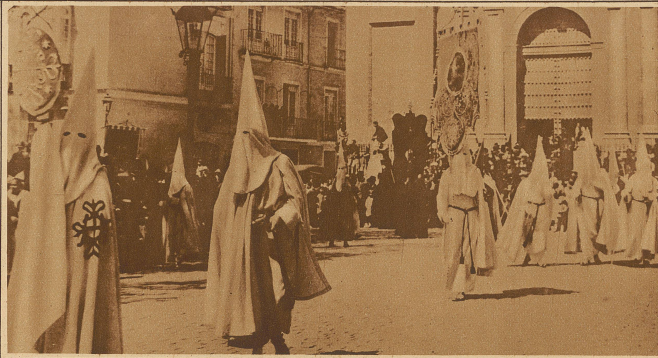
Mittelalterliche religiöse Gebräuche in Spanien. Malerische Prozessionen verummter Mönche durchziehen die Straßen der spanischen Städte