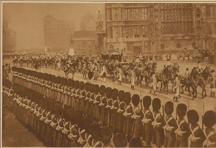
Die Staatskutsche mit dem englischen Königspaar in den Straßen von London auf dem Wege zum Parlament, dessen Eröffnung mit großem Pomp gefeiert wird