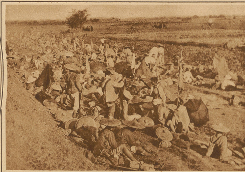
Soldaten der Kanton-Armee während einer Gefechtspause hinter der Front