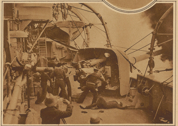
Ein englisches Kriegsschiff dient zur Verfilmung einer Seeschlacht. Zu Propaganda- und Belehrungszwecken wird gegenwärtig in England ein Film gedreht, der die Seeschlacht von Coronel im Jahre 1914 rekonstruieren soll. Unser Bild zeigt eine Geschützbedienung des Kreuzers Yarmouth in voller Kampftätigkeit