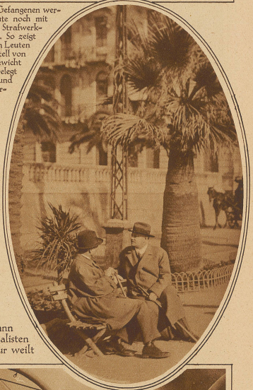
Bild rechts: Der deutsche Außenminister Stresemann in eifrigem Gespräch mit einem Journalisten in San Remo, wo er gegenwärtig zur Kur weilt