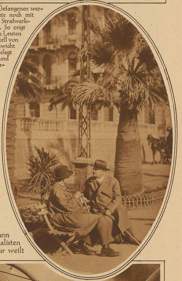
Bild rechts: Der deutsche Außenminister Stresemann in eifrigem Gespräch mit einem Journalisten in San Remo, wo er gegenwärtig zur Kur weilt