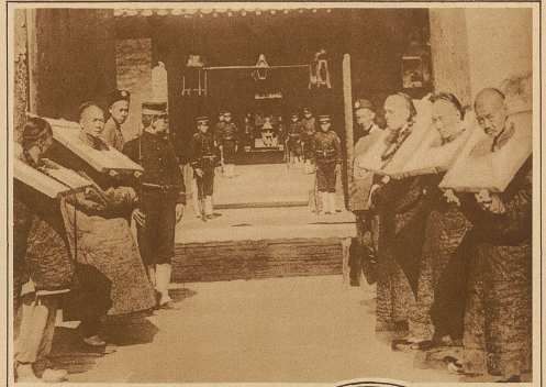
Die chinesischen Gefangenen werden teilweise heute noch mit mittelalterlichen Strafwerkzeugen behandelt. So zeigt unser Bild, wie den Leuten ein höheres Gestell von beträchtlichem Gewicht um den Hals gelegt wird, das sie Tag und Nacht mühslich hertumschleppen müssen

Die neueste Modetorheit, die übrigens diesmal nicht aus Amerika oder Paris, sondern aus Wien stammt, ist die Bemalung der Haare in einer zum Abendkleid passenden Farbe. Aber nicht nur zum Kleidepassend, sondern auch noch dem Charakter des Festes entsprechend, kann sich die Dame ihre Haare anstreichen lassen