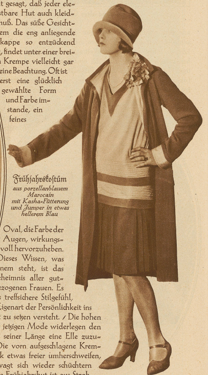
Frühjahrestostüm aus porzellanblauem Marocain mit Kasha-Fütterung und Juniper in etwas hellerem Blau

Oval, die Farbe der Augen, wirkungsvoll hervorzuheben. Dieses Wissen, was einem steht, ist das Geheimnis aller gut-angezogenen Frauen. Es ist das trefflichere Stilgefühl, das die Eigenart der Persönlichkeit ins rechte Licht zu setzen versteht. Die hohen Kopfformen der jetzigen Mode widerlegen den Satz, daß keiner seiner Länge eine Elle zusehen vermag. Die vorn aufgeschlagene Krempe läßt den Blick etwas freier umherschweifen, die Garnitur wagt sich wieder schüchtern hervor. Der neue Frühjahrsstut ist aus Stroh, aus Ramaille-Stroh, Wiska-Stroh, exotischem Stroh, - wer könnte die Namen alle behalten! Es wäre auch vergebene Mühe, denn bis man sie auswendig gelernt hätte, wären schon wieder ganz andere Hüte modern! L. St.