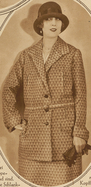
Praktisches Eile James Kostüm aus imprägniertem Wollstoff, Haarfilzhut