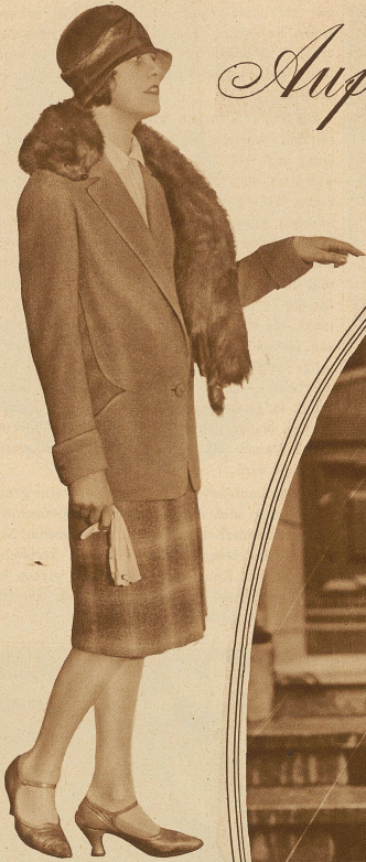
Frühjahrestostüm aus Friska-Stoff. Einfarbige Jacke mit kartiertem Röckchen