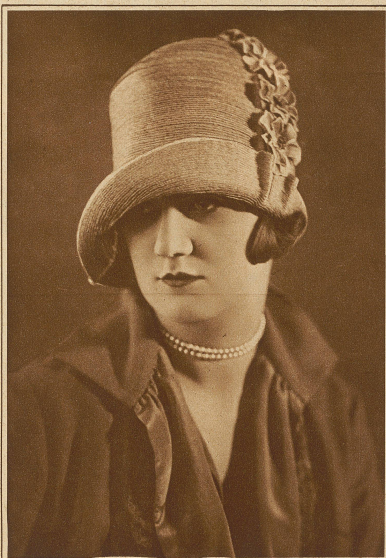
Frühjahreshut aus porzellanblauem Wiska-Stroh mit Samtblüten

Recht zu kommen. Die flotte Form mit Taschen u. Gürtel wird sich besonderer Beliebtheit erfreuen, denn sie macht außerordentlich jugendlich u. eine Mode, die dieses Plus aufzuweisen hat, muß das Rennen gewinnen. Die strengere Form des Smoking-Kostüms lebt in neuen Zusammenstellungen auf, wobei die großkarierten, knappesten Röckchen tonangebend sind. Dieser Anzug verlangt die Schlankheit der Gerte und den Gang des Rehs. Wer beides besitzt, wird von den Mitschwesterinnen beneidet, von den Herren bewundert werden. Unentbehrlich neben dem Kostüm bleibt immer der Mantel. Ueber dem Promenadenkleid aus feinem Wollstoff, bei Regenwetter aus summierter Changeant-Seide. Kommt