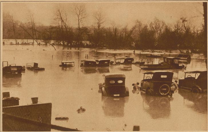
In Kalifornien, dem Lande des ewigen Frühlings, giebt es wahre Wolkenbrüche. Weite Gebiete stehen unter Wasser. Unser Bild zeigt einen vom Hochwasser überfluteten Parkplatz für Automobile