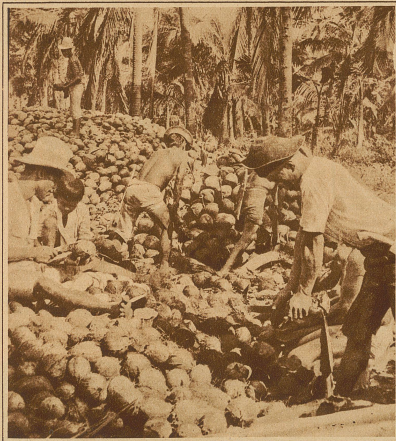
Ein interessantes Bild von der Kokosnußernte in Westindien. Alt und jung sind während dieser Zeit eifrig damit beschäftigt, die Nüsse für die verschiedenen Zwecke herzurichten