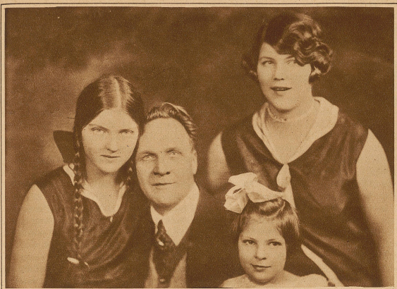
Der berühmte Sänger Schalajapin mit seinen drei Töchtern