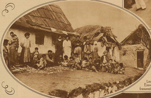
Links: Die Zigeunerhütten in Moldowa, deren Einwohner zum größten Teil an der Menschenfresserei beteiligt und jetzt in Haft genommen sind