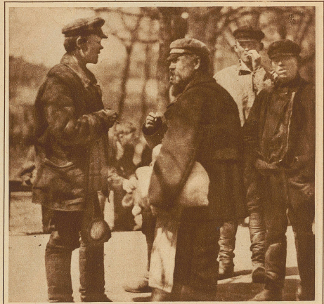
Moskauer Fabrikarbeiter während der Mittagspause