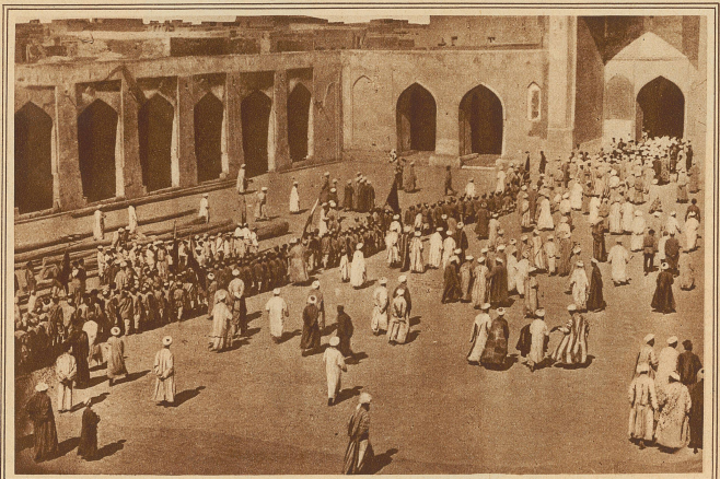
Ein festlicher Aufzug vor der Kalian-Medresse in Buchara