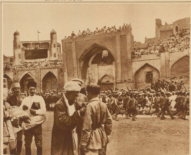
Der Vorsitzende des Exekutiv-Komitees von Buchara dekoriert die Helden der Roten Armee mit Kriegsauszeichnungen