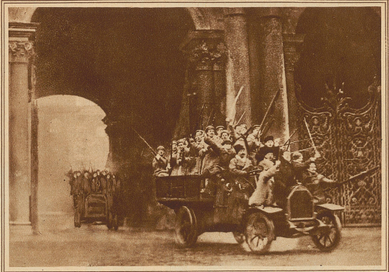
Die theatrale Wiederholung der Revolution: Erstürmung des Winterpalais; Automobile mit revolutionären Truppen passieren das Tor