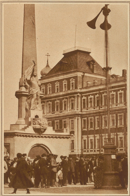
Auf allen belebten Plätzen Moskaus sind Lautsprecher aufgestellt, durch welche dem Publikum die Tagesneuigkeiten übermittelt werden. Unser Bild zeigt den Lautsprecher vor dem Revolutionsdenkmal auf dem Sowjetplatz