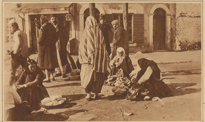
Szene auf dem Markt in Tirana