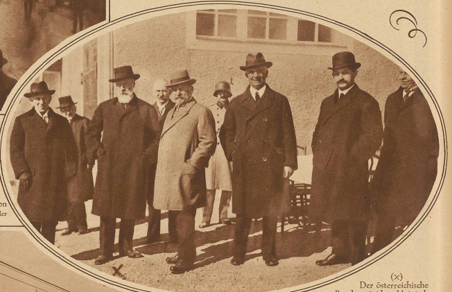
(X) Der österreichische Bundespräsident Hainisch an der Einweihungsfeier

Diese erste Seilschwebbahn im Bodensegebiet führt von Bregenz auf die 1040 m hohe Pfänderspitze