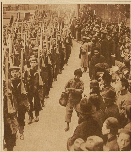
Britische Matrosen durchziehen eine der Hauptstraßen von Shanghai