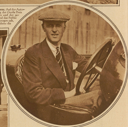
Major Seagrave, der bekannte englische Rennfahrer, erreichte am Dienstag auf der Piste von Dayton (Florida) mit seinem 1000-ferdigen Wagen eine Geschwindigkeit von 327 km in der Stunde