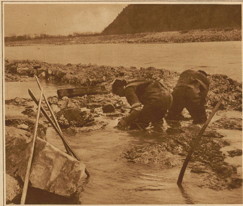
Mit Wasserhosen und Wasserstiefeln versehen, müssen die beschwerlichen Arbeiten im Wasser stehend verrichtet werden DIE RHEINKORREKTION BEI MONTLINGEN