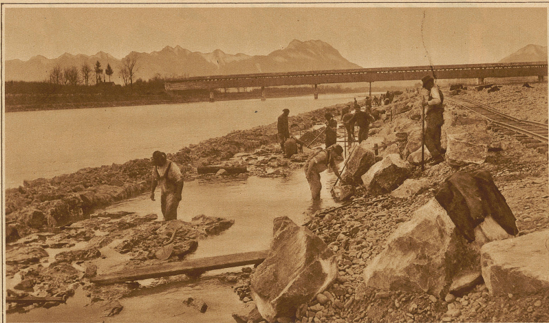
Erstellen des Damms auf dem Schweizerufer. An den Arbeiten sind gegenwärtig 250 Mann beschäftigt. Im Hintergrund die Brücke von Montlingen