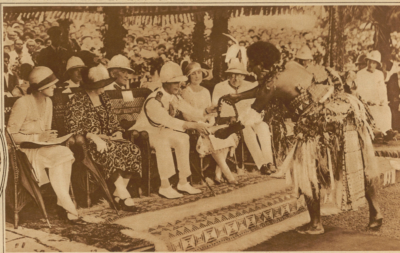
Besuch des Prinzen von York auf den Südseeinseln