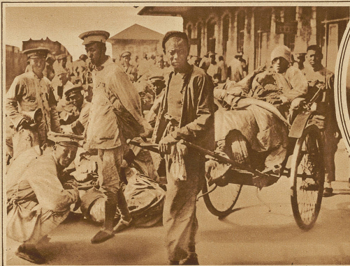
Verwundetentransport im Bahnhof von Shanghai