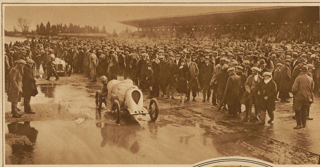
Das Publikum verhindert die Abhaltung eines Autorennens. Auf der Autobahn von Miramas bei Marseille sollte letzten Sonntag der Große Preis der Provence ausgetragen werden. Des schlechten Wetters und der gefährlichen Piste wegen erschienen nur 2 Wagen am Start und das Publikum, das sich so um die erwarteten großen Sensationen betrogen sah, dräng nach der ersten Runde in die Bahn ein und verhinderte die Weiterfahrt