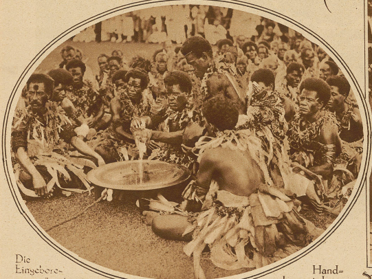
Die Eingeborenen präparieren zu Ehren des Prinzen eine Bowlle. Diese symbolische