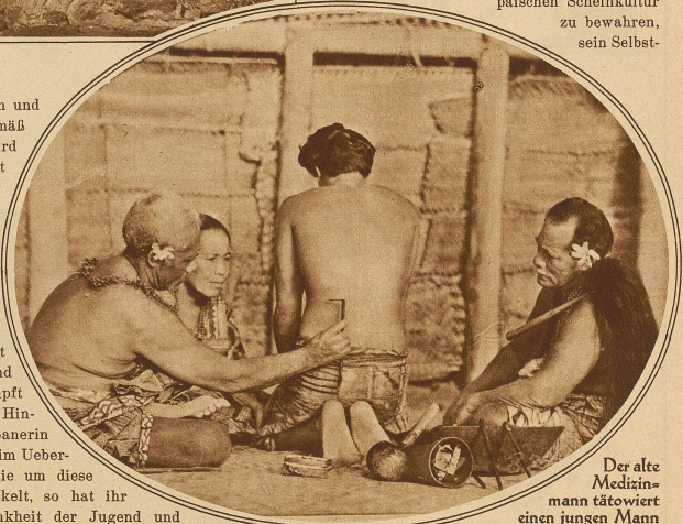
Der alte Mediziner tätowiert einen jungen Mann

Familie jeder Jüngling zugeschiedt, wenn er die Pflichten und die Verantwortung des Erwachsenen übernehmen soll. Gemäß den ungeschriebenen Gesetzen und heiligen Bräuchen wird keiner als vollwertiger Mann betrachtet, bevor ihm nicht alle möglichen phantastischen Zeichen mittels harter Knochennadeln auf die Hinterpartie eingespritzt worden sind. / Ueber die Samoaner schreibt Scheurmann: «Edel geformt sind die Stirne und besonders die großen, dunkelbraunen, oft bernsteinfarbigen Augen, die lange, dunkle Wimpern umsäumen. Was aber allen Gesichtern ihren anziehenden Reiz gibt und andere formale Mängel völlig vergessen läßt, das ist der allen gemeinsame lebenswürdige Ausdruck. Alle strahlen gleichsam; selbst die ersten Gesichter der Männer und älteren Frauen sind nie in sich verkrampft oder verstarbt, sondern künden wache Hingegenheit ans Dasein. / Die Samoanerin ist am schönsten im Jungfrauenalter, im Uebergang von Mädchen zur Frau. Ist sie um diese Zeit zumeist auch schon voll entwickelt, so hat ihr Körper doch noch die feine Schlankheit der Jugend und schöne ausgeglichene Formen. Diese Schönheit verblüht schnell: wohl den meisten Frauen ist nach der Reife etwas Lastendes eigen... Nur die weichen, schmalfingerigen Hände bleiben wohlgeformt und verlieren fast nie ihre Behendigkeit und Anmut.