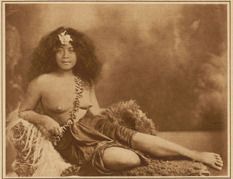
Eine hübsche junge Samoanerin

Entzückend ist ihr Siva-Siva-Tanz. Er möchte uns im ersten Augenblick beinahe als eine Modifikation des Shimmy oder Charleston erscheinen; aber bei aufmerksamem Zuschauen gewahren wir, daß jede Bewegung dieser apollinischen Menschen in einer poetisch-symbolischen Sprache die geheimen Regungen der Seele, die Gefühle der Lust und des Schmerzes, der Angst und des Entsetzens zum Ausdruck bringen soll. Die jahrhundertealten Tänze der Eingeborenen sind aber nicht nur voller Zartheit und von einer hinreißend melodiosen Anmut, sondern oft gleichzeitig von einer erschreckenden Wildheit. Die Tänze werden beim Hochzeitsfest und bei der Zeremonie der von Scheurmann klassisch geschilderten Tötowierung ausgeführt, welcher jeder Jüngling beim Eintritt der Mannbarkeit unterworfen wird. Auf Samoa nämlich blüht die seltsame Kunst der Tätowierung wie nie zuvor. Der offizielle Tätowierer gehört zu den gewichtigsten Persönlichkeiten des Dorfes. Ihm wird von der