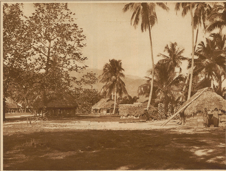
Dorfplatz in Saluafata

zu...» / Viele Forscher führen die Entstehung der Südseeinselwelt auf vulkanische Ausbrüche zurück; andere halten sie für die letzten höchsten Reste eines früheren Festlandes. Manche der niederen Inseln verdanken ihre Entstehung sicher der Korallenbildung. Die Koralle nämlich siedelt sich auf einem Berge am Meeresgrunde an und baut immer höher hinauf bis zum Meeresspiegel. Und wenn dann die Brandung auf die obersten Schichten abgestorbene Korallenstücke wirft, dann bildet sich ein langsam aus den blauen Fluten auftauchendes Atoll — eine kleine Insel. Das Wasser schwemmt ein wenig Erdreich an u. die Winde u. Wellen tragen Pflanzensamen verschiedenster Art her. Bald erhebt sich in dem jungen Paradies die erste schlanke Palme.