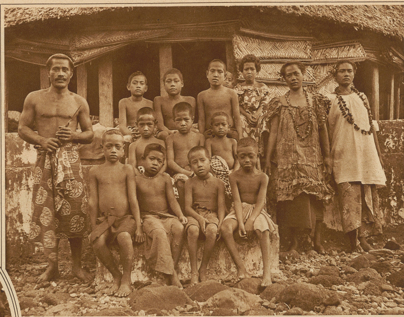
Dorfschule auf Samoa

wie viele Leute mit regen geistigen Interessen die in der Südsee verlebten Jahre geradezu als «verlorene» bezeichnen, da sich bei ihnen infolge des Klimas und der Einsamkeit häufig eine seelische Zerrüttung und Hand in Hand damit der körperliche Verfall einstellt. — Rummel stimmt einen erhebenden Hymnus der Liebe zur Sonne und zur Natur an. Herrlich schildert er den Einbruch der Nacht in den Sonnenländern: «Wenn die Sonne ins Meer niedergetaucht ist, schimmert ihr noch lange eine leuchtende Farbenorgie von schwarzen und goldenen, blaßrosa und lila, lichtblauen und tiefsamtblauen Tönen, ein bei uns nie gesehener Farben- und Feuerzauber nach. Das Meer leuchtet noch in rotgoldgrünem Abendglanz; im Osten ist zu gleicher Zeit schon der Mond aufgestiegen, glutrot wie ein arbeitender Vulkan, das Haupt unheilrohend und finster von schwarzem Dunstgewölk umhüllt. Höher steigt er und wandelt sein Glutrot in lachendes Gold-golden. Weiter klimmt er empor, silbern wird nun sein Gewand. Er breitet sein leuchtendes Kleid über die rollende See, ihr Ruhe und