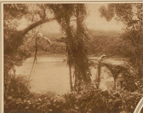
Der Kratersee Lanuto'o

Frieden gebietend. Da werden die Wellen, die Wogen ganz still, flüstern und lispeln nur mehr leise; rings schlafende, träumende Silbersee. Und schneeweiß und silbern, ein stummer, glänzender Schwan, gleitet unser Schiff mit weitausgebreiteten, leuchtenden Schwingen lautlos durch silberschimmernde Flut, gleitet dahin durch weichmilde Tropennacht, dahin unter Sternen und nie zu lösenden Fragen des Firmaments und über unerforschte Rätsel tiefster Meeresgründe, gleitet südwärts, immer südwärts, unter dem Sonnenbanner der Sonne