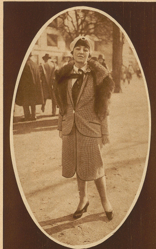
Was die Mode