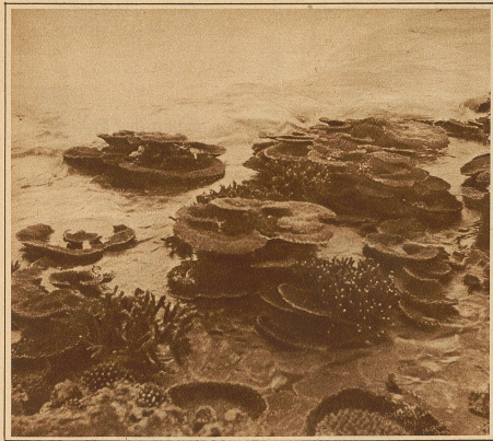
Korallen bei Ebbe

bei uns nie zu sehen bekommt. Da gibt es samtblaue und purpurrote, tief schwarze und braune, gelbgrüne und matigrüne, rosa, violette und perlmutterartige Fische! Zu diesem phantastischen Farbenspiel der Bewohner der kristallklaren Fluten gesellt sich oft eine groteske und abenteuerliche Form: da trifft man stachelbewehrte Fische mit wahren Dolchen und Schwertern und andere mit krummem Papageischnabel oder solche mit glotzenden Eulenaugen. Rummel erzählt gar von einem drolligen Kumpanen, der sich mit Wasser und Luft in der Tiefe kugelförmig aufbläst und ans Tageslicht befördert wie ein Kinderluftballon ausläuft und kläglich zusammenschnürt. Die Eingeborenen fangen die Fische mit der Angel und mit Speeren. Oft wird eine Jagd veranstaltet auf die schweren, häßlichen Haie, in deren breitem Schädel winzige Aeuglein tückisch lauern. Noch weit gefährlicher als dieser schmutzgelbgrüne Geselle sind der Seehecht und sein Bruder, der sog. Hornhecht, der den nackten, braunen Insulanern beim nächtlichen Fischfang direkt nachspringt (nach Art der fliegenden Fische) und versucht, ihnen seinen nadelspitzen Dolch zwischen die Rippen zu bohren.