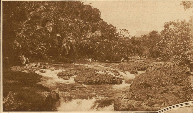
Wasserfall auf Upolu

Der Samoaner ist, außer jedem Zweifel, aus seinem Weltsein begriffen, ein hochstehender, begabter Mensch mit vielen Tugenden und Talenten. Seine Fehler wiegen nicht schwer, und es gibt auch für den Europäer manchen Anlaß, von ihm zu lernen. Unsere Pflicht ist es, ihn möglichst vor den Einflüssen einer gewissen europäischen Scheinkultur zu bewahren, sein Selbst-