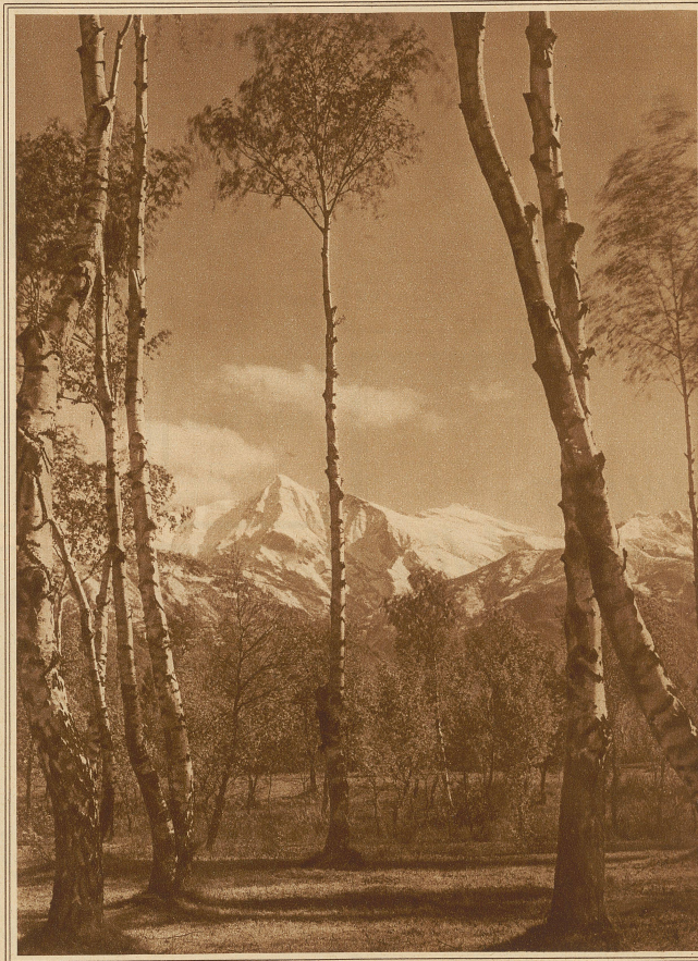
LANDSCHAFT BEI ASCONA (TESSIN)

«Abdullah, du wirst uns helfen, nicht wahr?» — lispelte er und umarmte mit beiden Armen den unförmigen Hals des Kamels. Und Abdullah beugte den Kopf herunter und leckte mit seiner langen, roten Zunge Parkers Hand.