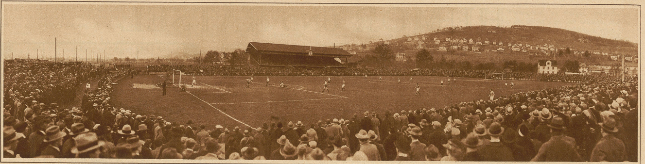
Gesamtansicht des Sportplatzes Förlibuck während des Cupfinals Grasshoppers-Young Fellows