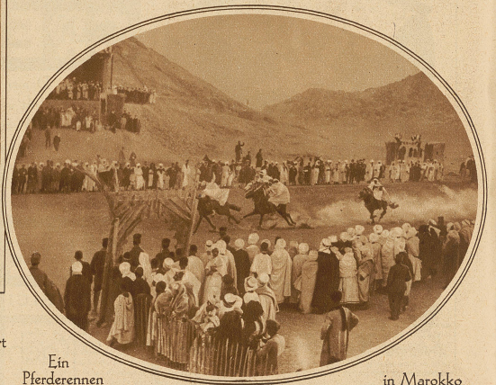
Ein Pferderennen in Marokko