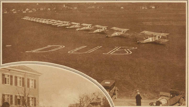
Die teilnehmenden Flugzeuge beim Start auf dem Flugplatz Dübendorf