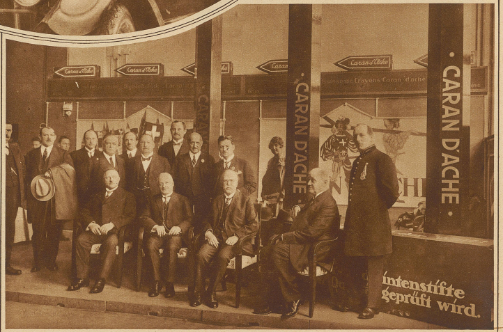
Bundespräsident Motta und Bundesrat Schulthess am offiziellen Tag der Basler Mustermesse