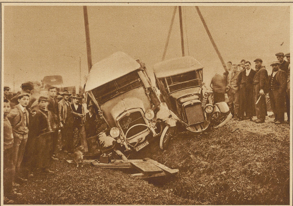
Beim Vorfahren mit geringer Geschwindigkeit fuhr auf der Zugerstrasse ein Personenwagen infolge Versagens der Steuerung seitlich in einen Saurelastwagen hinein und schob ihn seitwärts in einen Graben hinunter. Personen kamen dabei glücklicherweise keine zu Schaden