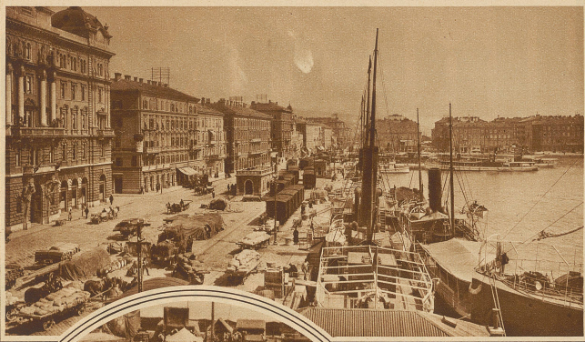
Der Hafen von Fiume, der nach dem italienisch-ungarischen Abkommen in Zukunft hauptsächlich dem ungarischen Außenhandel dienen wird