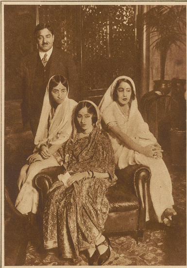
Der Maharadja von Tehri Guawall, der sich mit seinen drei Lieblingsfrauen gegenwärtig auf einer Reise durch Europa befindet