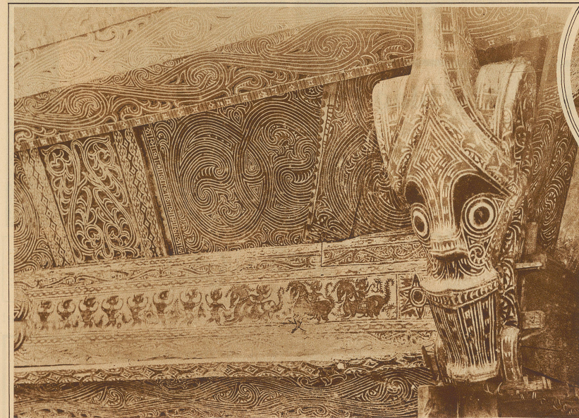
Eigenartige Schnitzereien und Malereien als Eckverzierung an einem Batakhaus in Lagoe Buti

Kyma, einem Urmotiv der Griechen, der eingehängten Spirale, dem Hakenornament, dem Akanthusblatt etc. In Erstaunen setzen die rhombischen und deltaförmigen Figuren, deren geometrische Wesenheit ihnen unbekannt ist. Daher sind sie auch nicht das Resultat der Abstraktion, sondern das unmittelbare Produkt ihres angeborenen ästhetischen Gefühls, das in der Betrachtung der umgebenden Natur geschult und ausgebildet worden ist. Figürliche und stilisierte Gebilde spielen ebenfalls eine nicht unbedeutende Rolle. Die Kunstfertigkeit der Batak'schen Schnitzkunst können wir vor allem an den sehr wirkungsvoll zur Geltung kommenden, an den Häusern angebrachten Verzierungen bewundern. Oftmals unter-