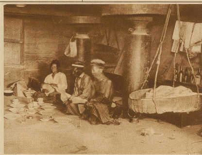
Im Innern eines Batakhauses. Beachtenswert sind die runden Scheiben zwischen den Balken, die den Ratten das Hinaufklettern unmöglich machen. Rechts hängt eine Kinderwiege an der Diele

Kyma, einem Urmotiv der Griechen, der eingehängten Spirale, dem Hakenornament, dem Akanthusblatt etc.