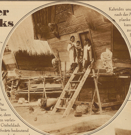
Batakmutter mit ihren Kindern auf der Veranda ihres Hauses. Man beachte die reiche Schnitzerei am Giebel des Hauses

Form und Gestalt der Batakhäuser entspringen dem Bedürfnis der Menschen, sich vor den Unbilden des Wetters zu schützen, modifiziert durch die lokalen klimatischen Verhältnisse, die Bodenbeschaffenheit, sowie das hier zur Verfügung stehende Baumaterial. Charakter erhalten diese Gebäude durch die landesüblichen Sitten, die individuelle Auffassung und einen den Bataks angeborenen Schönheitssinn, der bei ihrem Hausbau stark zum Ausdruck kommt. Die Wohnhäuser haben eine rechteckige Basis mit einer Tiefe von 12 bis 16 m und einer Breite von 10 bis 13 m. Sie ruhen auf 3-4 m hohen kräftigen, aus dem dauerhaften Ingolholz gefertigte Holzsäulen. Die aus Brettern gefügten und nach außen geneigten Wände sind kaum 1 1/2 m hoch. Auf diesen sitzt das riesige, dem Ganzen ein ebenso originelles als typisches Aussehen verleihende, hohe, nach beiden Langseiten steil abfallende Giebeldach. Besonders charakteristisch an diesem sind die nach aufwärts bedeutend breiter werdenden Seitenteile, so daß die Firstenden an der Front und Rückseite häufig weit über die Basis des Hauses hinausragen. Der First selbst ist eingesattelt, ursprünglich wohl unabsichtlich durch das Nachgeben des nicht genügend starken Baumaterials entstanden und heute zur architektonischen Absicht geworden. / An den Firstenden sind zur