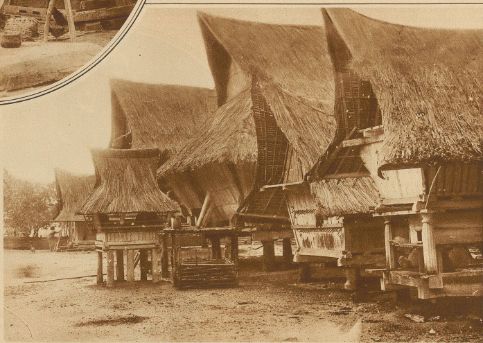
Karo-Batak Häuser im Sibulangeit. Vor den Häusern eine kleine Geflügelhütte, rechts die gemeinsame Reisscheune

ten hergestellte und den einzelnen Familien als Schlafstelle dienende Nischen. Von der Tür läuft gerade zur entgegengesetzten Seite eine 50 cm breite und 30 cm tiefe Rinne, die gleichsam einen Gang bildet und außerdem zur Aufnahme des