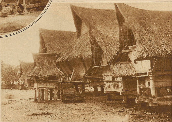
Karo-Batakhäuser im Sibulangeit. Vor den Häusern eine kleine Geflügelhütte, rechts die gemeinsame Reisscheune

ten hergestellte und den einzelnen Familien als Schlafstelle dienende Nischen. Von der Tür läuft gerade zur entgegengesetzten Seite eine 50 cm breite und 30 cm tiefe Rinne, die gleichsam einen Gang bildet und außerdem zur Aufnahme des