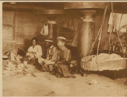
Im Innern eines Batakhauses. Beachtenswert sind die runden Scheiben zwischen den Balken, die den Ratten das Hinaufklettern unmöglich machen. Rechts hängt eine Kinderwiege an der Diele

Kyma, einem Urmotiv der Griechen, der eingehängten Spirale, dem Hakenornament, dem Akanthusblatt etc. In Erstaunen setzen die rhombischen und deltaförmigen Figuren, deren geometrische Wesenheit ihnen unbekannt ist. Daher sind sie auch nicht das Resultat der Abstraktion, sondern das unmittelbare Produkt ihres angeborenen ästhetischen Gefühls, das in der Betrachtung der umgebenden Natur geschult und ausgebildet worden ist. Figürliche und stilisierte Gebilde spielen ebenfalls eine nicht unbedeutende Rolle. Die Kunstfertigkeit der Batak'schen Schnitzkunst können wir vor allem an den sehr wirkungsvoll zur Geltung kommenden, an den Häusern angebrachten Verzierungen bewundern. Oftmals unter-