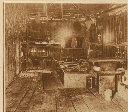
Blick in eine Batak-Küche auf Sumatra. Rechts sehen wir den großen Reishälter und daneben den Feuerherd

Verzierung oftmals natürliche oder in Holz geschnitzte, buntbemalte Büffelköpfe mit Hörnern oder andere hölzerne Figuren angebracht. Die Front und oft auch die Rückseite sind mit je einer 1-1,30 m hohen zweiflügeligen, sich nach innen öffnenden Tür mit Holzriegel versehen, vor der sich eine Altane befindet, zu der man auf einer Leiter oder einem einfachen, mit Einkerbungen versehenen Bambus gelangt. / Das Innere des Hauses bildet einen einzigen großen, in Ermangelung von Fenstern, die höchstens durch schielschartenartige Öffnungen angedeutet sind, finsternen Raum. In den Häusern der Vornehmsten findet man an den Wänden durch Mat-