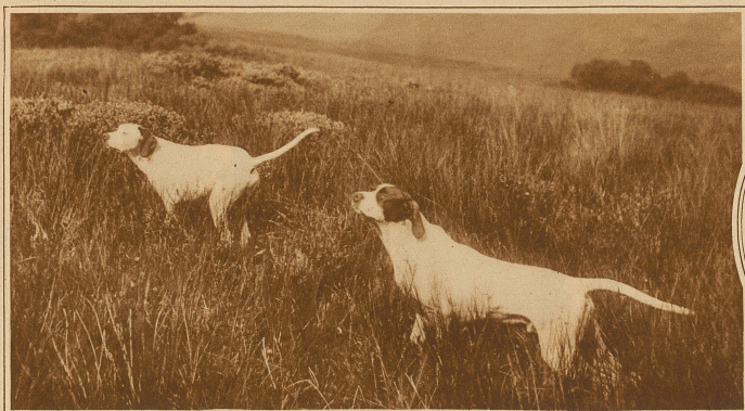
Pointers an der Arbeit