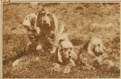
Labradorhund mit wildem Kaninchen