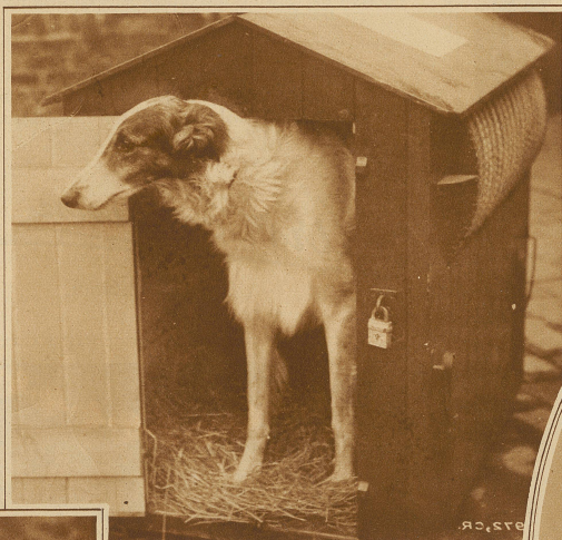
Barzoy in praktischer und zweckmässiger Hütte