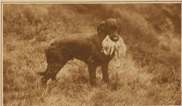
Otterhund, dient speziell für die Jagd auf Fischotter