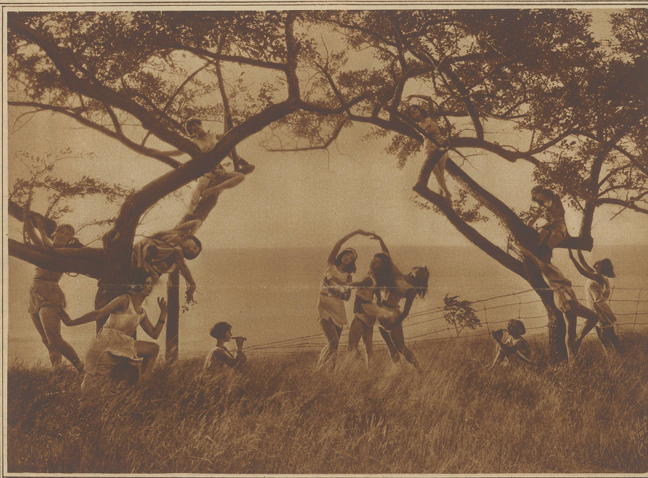
Swizer Frühling — Tanzstudie einer Ballettschule

«Doch,» sagte er, «Hilmer ist zusammen mit Winkelmann bei uns gewesen, um uns zu verlassen, verschiedene Untersuchungen bezüglich des Einbruchs anzustellen. Es ist ganz richtig, er hat sich in den Kopf gesetzt, Sie seien ein großer Verbrecher und er ist in der Tat so eifrig, daß ich Ihnen raten möchte, vorsichtig zu sein. Sie werden sehen, früher oder später wird er Sie hereinlegen.»