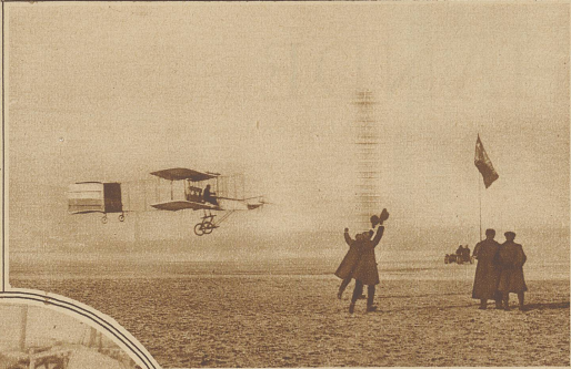
Farman landet am 13. Januar 1908 auf dem Flugplatz von Issy les Moulineaux nach seinem Rundflug von 1 Kilometer

zunächst war, mit einem Lederriemen an die Maschine zu binden. Als er die blauen Haare nur anrührte, sang ein elektrischer Strom in sein Blut hinein, von einer so unirdischen Süße, daß er nur, seine ganze Kraft spannend, die Hand zurückziehen konnte, während sein Gehirn in den Taumel einer seltsamen Gefangenheit geriet.