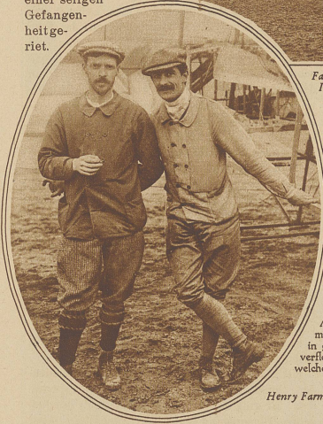
Henry Farman (links) und Gabriel Voisin, der Konstrukteur des nach ihm benannten Biplans

Aber unter dieser Lähmung dachte er schon, von Liebe ergriffen, der Wissenschaft und allen möglichen Verdiensten vergessend, das Rätselwesen, ohne einem Menschen davon zu sagen, in seinem Zimmer für sich versteckt zu halten. Eine Vorahnung einer fremden, noch unbekanntem Wollust jagte ihm das Blut in die Augen, daß Hände, Arme, Steuer purpurn vor ihm glühten. Fast von Sinnen, ein Raubvogel mit seinem Fang, schoß er mit ungeheurer Ge-