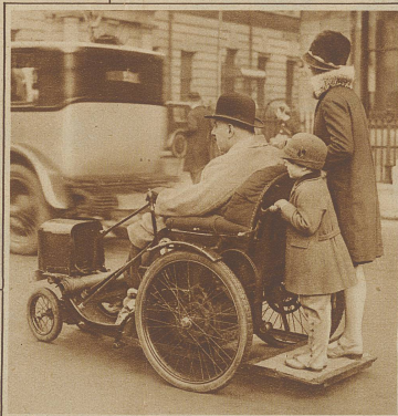
Ein neuer Krankensstuhl mit elektr. Antrieb. Auf diese Weise ist es dem im Bilde ersichtlichen engl. Parlamentsmitglied Major Cobham möglich, mühelos zu den Sitzungen zu fahren. Hinten auf der Plattform stehen als Passagiere seine beiden Kinder